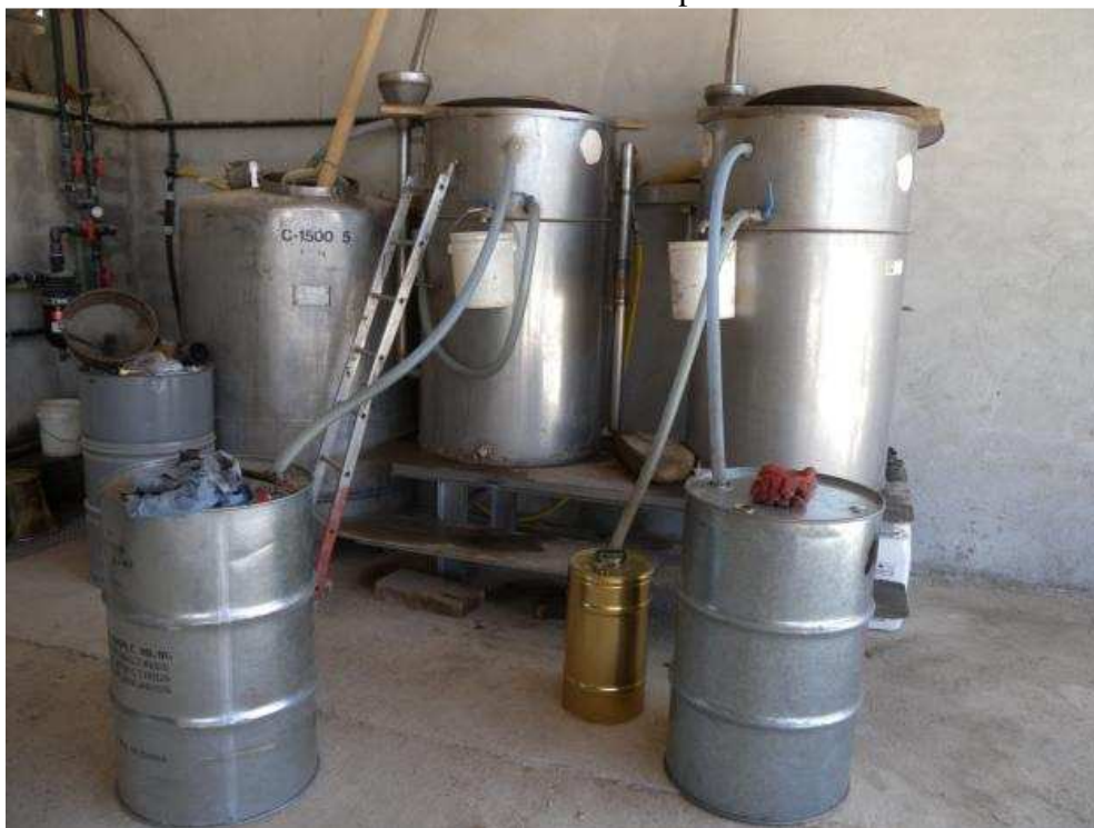
Photo 2 Exploitation lavandicole sur le plateau de Valensole