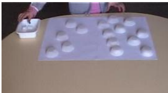
Figure 1. La situazione degli zuccheri