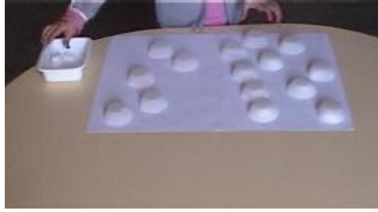
Figure 1. La situazione degli zuccheri