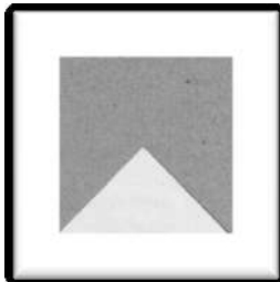
Figure 2 : position correcte de la pièce du puzzle du carré

Dans ces conditions on ne peut pas trouver qu'il convient de placer le triangle dans la position suivante (fig. 2).