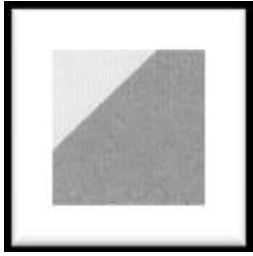
Figure 1 : superposition des angles droits du carré et du triangle rectangle

quoï on ne peut que s'obstiner à placer l'angle droit de l'un des triangles en superposition de l'un des angles droits du carré (fig. 1), ce qui est le cas de tous les élèves au début de leur recherche.