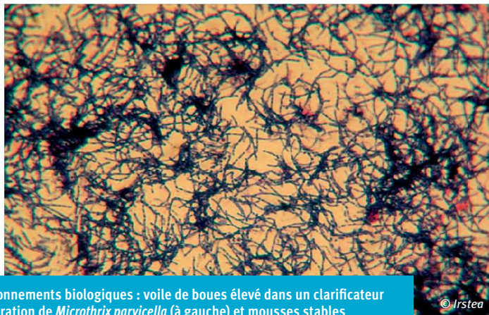
❶ Dysfonctionnements biologiques : voile de boues élevé dans un clarificateur dû à la prolifération de Microthrix parvicella (à gauche) et mousses stables en surface d'un bassin d'aération dues à la prolifération de Mycolata (à droite)