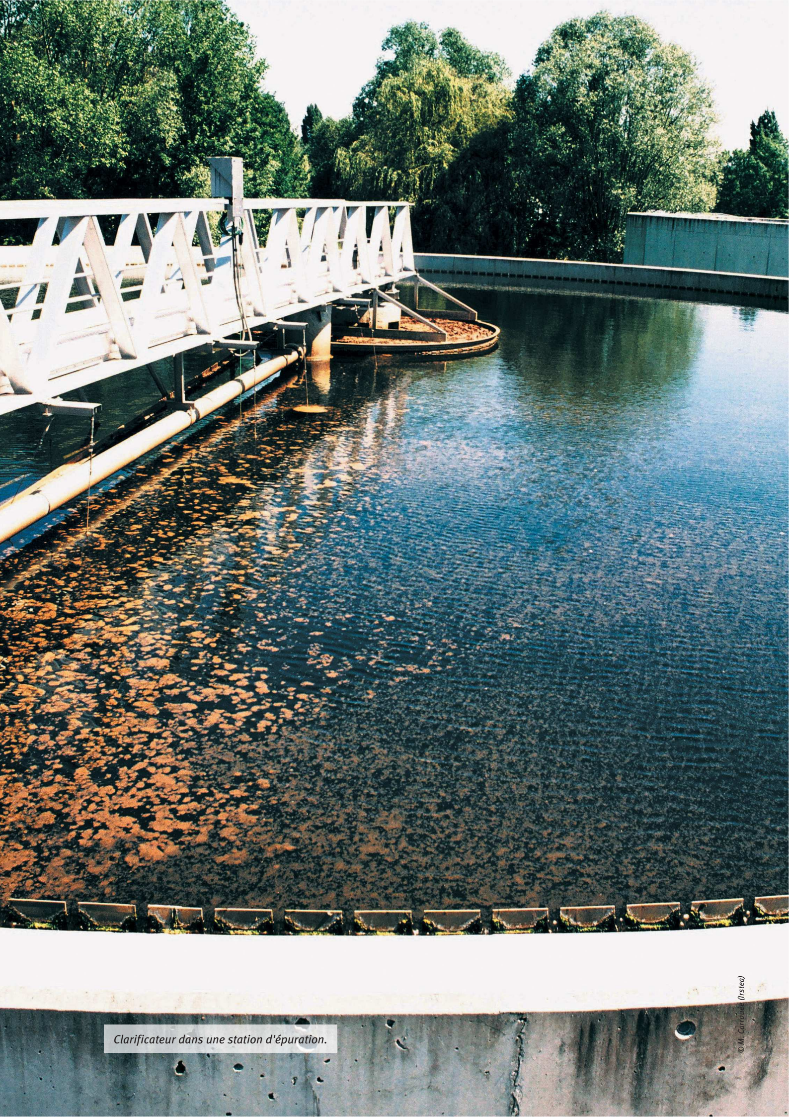
Clarificateur dans une station d'épuration.