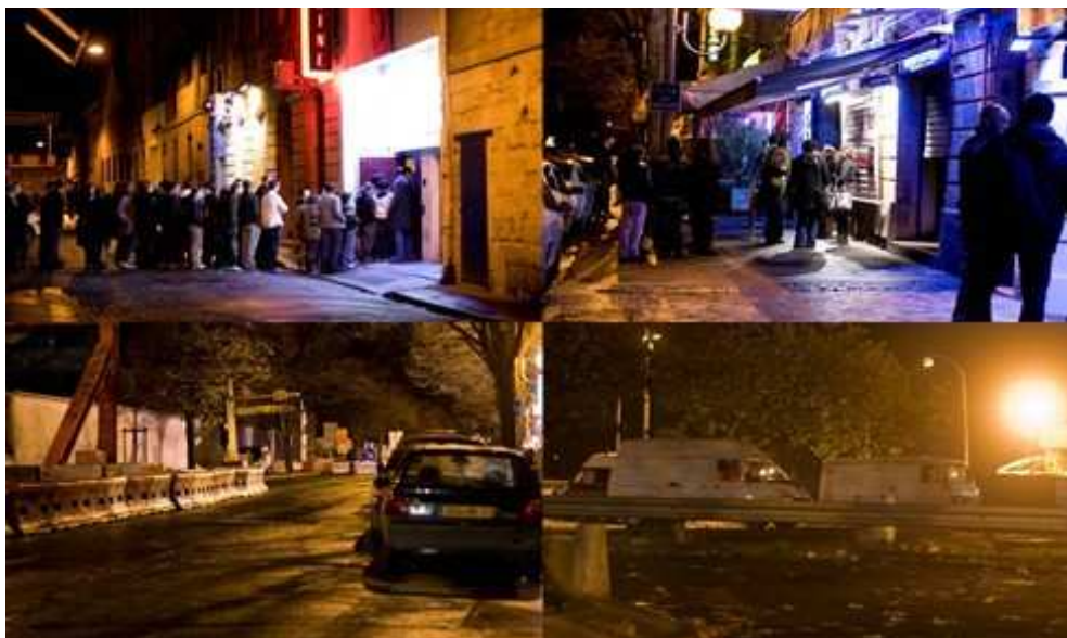
Figure 2. Le quai de Paludate