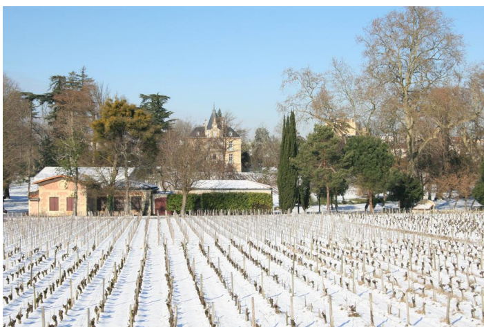
Photo. n° 1 : Le vignoble du château Les Carmes-Haut-Brion sous la neige. Vendu en 2010 pour 18 millions d'euros, il témoigne de l'envolée des prix qui touche les plus grands vins de Bordeaux, alors qu'un tiers des exploitations aquitaines n'a pas de successeur. Pessac, cliché Raphaël Schirmer, 2012.

Chaque seconde, cinq bouteilles de Cognac sont vendues dans le monde. Les exportations de vin français représentent en 2011 l'équivalent de la vente d'une centaine d'airbus (plus de dix milliard d'euros). C'est dire si le vignoble français a réussi à mettre en place un modèle efficient d'organisation territoriale pour produire des vins de qualité. Pour autant, les volumes ne cessent de décroître depuis 2007, et l'essentiel de la croissance est tiré par les vins de Bordeaux, frappés par une extraordinaire spéculation (photo. n° 1). La compétition mondiale est difficile, et la place relative de la France est sans cesse grignotée par l'Espagne et Italie, mais aussi par le Nouveau Monde.