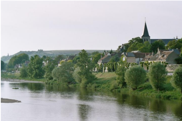
Photo. n° 2 : Comme le long de nombreux fleuves, la Loire présente tout une collection de villages viticoles qui se suivent les uns les autres. Les vignes se trouvent sur les coteaux en arrière-plan. Pouilly-sur-Loire, cliché Raphaël Schirmer, 2006.

Seules quelques régions viticoles échappent peu ou prou à cette normalisation. Ici parce que le négoce est historiquement puissant (Champagne, Cognac), là parce que les viticulteurs se sont tournés vers d'autres voies que les AOC (Languedoc-Roussillon), plus loin parce que des raisons locales interagissent pour rendre plus complexe le tableau (avec par exemple le Saint-Emilionnais plutôt marqué par la petite propriété alors que le Médoc ou Pessac-Léognan sont le règne des grands châteaux). Mais globalement, les paysages, hier encore densément peuplés, toujours aménagés tels de véritables jardins, attestent de l'originalité française en matière de production de vins de qualité (photo. n° 2). L'équilibre, fragile, est directement menacés par les vins industriels et a-géographiques de la mondialisation. Les vignobles les moins valorisés sont aujourd'hui en crise.