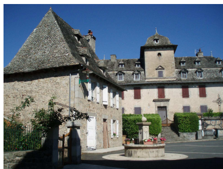
Le bourg de Mourjou