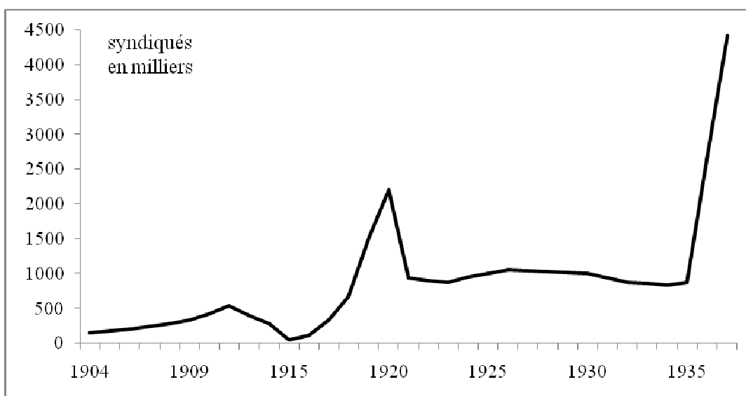
Graphique 1. La syndicalisation à la CGT de 1906 à 1937 (milliers d'adhérents)

Interpolation pour les années manquantes (1907, 1909, 1922, 1923, 1925, 1927, 1929, 1931, 1933)