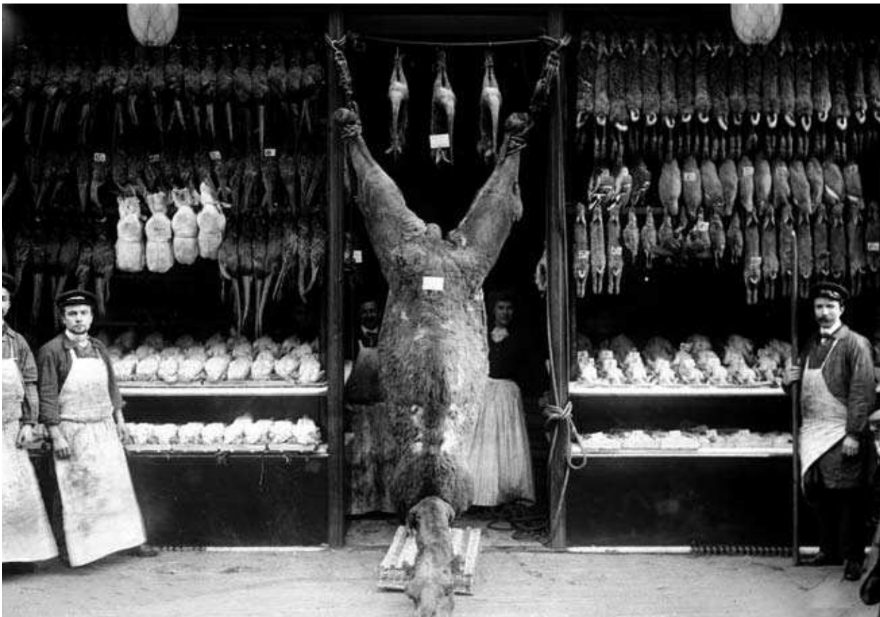
L'espace utilisé comme lieu de l'expérimentation est le rayon ( chameau exposé à la devanture d'un marchand de gibier et de volaille, Paris, 1908 ).

stand vers la chambre froide à partir de 21 h 20 et à commencer le nettoyage des machines dix minutes plus tard. Ainsi, les clients ne sont pas toujours servis après 21 h 30 (alors que l'hypermarché ferme à 22 heures), notamment dans l'hypothèse où la demande nécessite l'utilisation d'une machine de découpe: il faut en effet à nouveau la nettoyer, après utilisation. Des clients s'en sont déjà plaints, par l'intermédiaire de la boîte à idées. Là encore, le chef de rayon confirme l'existence de ce problème, considérant que les vendeuses commencent trop tôt le rangement et le nettoyage afin d'« en finir le plus vite possible ». « Belle mentalité! », ajoute-t-il en précisant qu'il ne peut pas résoudre ce problème: « Moi, je quitte le magasin à 20 heures, alors... »;