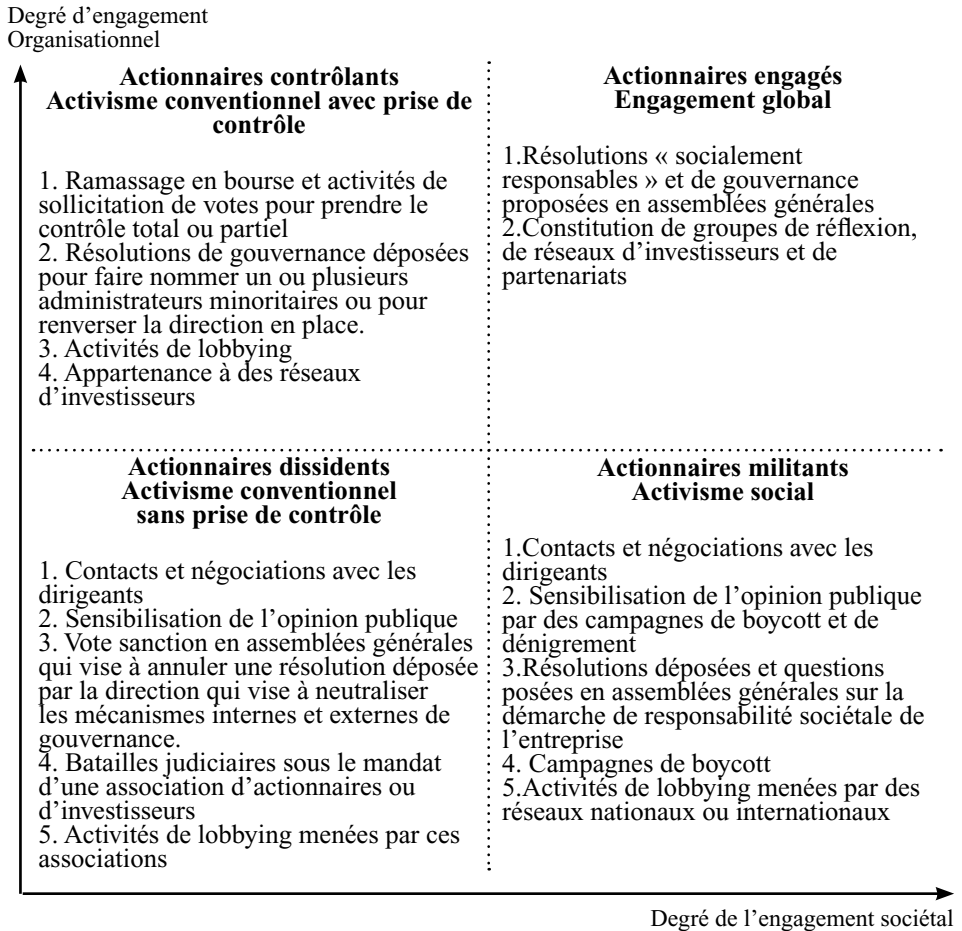
Figure n°1 : Une nouvelle segmentation des actionnaires actifs et de l'activisme actionnarial

La première variable de segmentation retenue intitulée « degré d'engagement organisationnel » a fait l'objet de nombreuses recherches en gestion des ressources humaines [Meyer et Allen, 1991, 1997] et plus récemment, en finance [Guillot-Soulez, 2005]. Ces travaux mettent en évidence trois dimensions de l'engagement organisationnel, celui-ci pouvant être normatif, affectif ou de continuité.