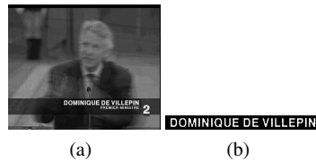
Figure 2. Images moyennes et binarisées

La reconnaissance du texte est effectuée toutes les 10 trames entre la trame d'apparition du texte et sa trame de disparition. Ces multiples détections nous permettent d'avoir plusieurs possibilités de retranscription de chacun des textes. Ces multiples possibilités sont fusionnées pour obtenir la transcription la plus probable.