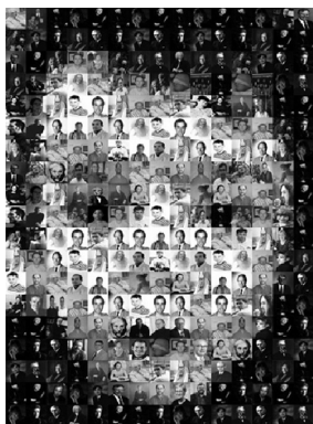
Figure 7: Reynald Drouhin, J'eux, http://www.incident.net/works/j-eux/ , 2001.

Des_Frags propose de réutiliser des éléments préexistants sur le web – des images fixes – pour composer une image mosaïque. Chaque internaute est invité à sélectionner sur Internet ou dans ses propres archives une première image. Cette image «matrice» va composer la trame sur laquelle viendront s'afficher d'autres images récupérées sur le web. À l'aide d'un moteur de recherche mis à sa disposition, l'internaute est en effet appelé, à partir de deux ou trois mots clés, à collecter sur le Net un grand nombre d'autres images qui viendront se coller – telles des vignettes – sur l'image mosaïque finale. L'œuvre résulte ainsi du piratage et du partage d'images reprises et détournées de leur contexte initial.