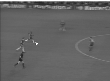
Figure 6 : Samuel Bianchini, Training Center, www.dispotheque.org, 2005.

Dans le contexte de l'art numérique en ligne, ou Net art, l'heuristique du concept de dispositif résulte de sa capacité à rendre compte de l'inclination vers l'autonomie des diverses composantes de l'œuvre. Le dispositif Net art renvoie, d'une part, à l'action de disposer et de mettre dans un certain ordre les divers éléments qui composent l'œuvre ; et d'autre part, il désigne le résultat de cette action. Le dispositif, ici entendu en tant que machine et comme mécanisme, subsume tout à la fois l'acte et la manifestation artistique, et inclut ainsi des possibilités de comportements 5 . Considérons de ce point de vue trois œuvres exemplaires :