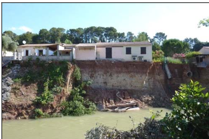
Photo 5 - La Motte - Sapement de berge au niveau du lotissement "Les hauts de la Nartuby".