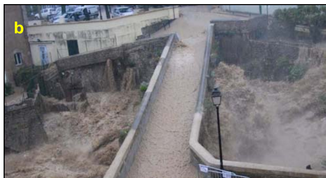
Photos 4 - Trans - a : Inondation en rive gauche à 20h29. b : La Nartuby sous le pont Bertrand à 19h14.

Enfin, au Muy (bassin de 225 km 2 ), les habitations et les commerces en bord de Nartuby ont été inondés. Le pont de la D7 a constitué un élément d'autant plus aggravant qu'il a été obstrué par un mobile-home, des voitures et divers débris.