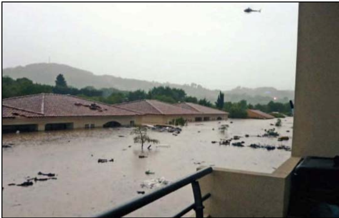
Photo 3 - Draguignan : Le lotissement "Les Florentins", dans la partie sud-ouest de la ville.