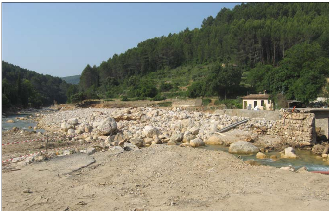
Photo 1 - La Nartuby au niveau et en aval du pont de Rebouillon en juillet 2010.

À Rebouillon, c'est vers 16h30 que les écoulements sont devenus de plus en plus violents. La perturbation provoquée par le pont joignant le hameau aux résidences de rive droite a entraîné le dépôt des blocs charriés par la rivière (Photo 1). Le courant s'est déplacé en rive gauche, creusant un nouveau lit. Une maison, malheureusement occupée, a été emportée. Le débit de pointe a sans doute dépassé 300 m 3 /s (bassin de 149 km 2 ).