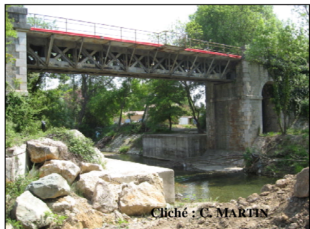
Photos 2 - Draguignan : un obstacle en aval de la ZAC, l'ancienne voie ferrée.