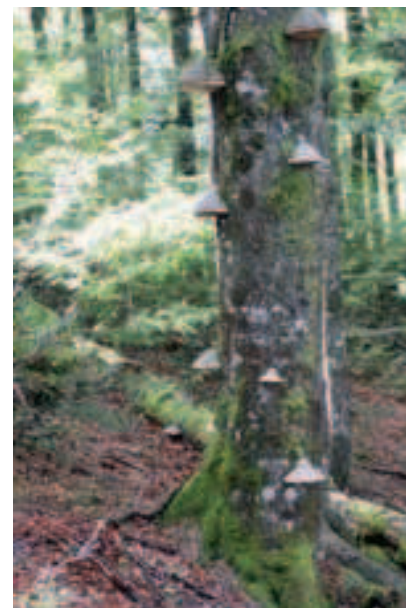
H. Voiry, ONF