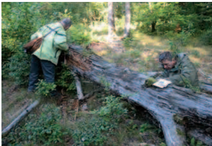
P. Blanchard, ONF