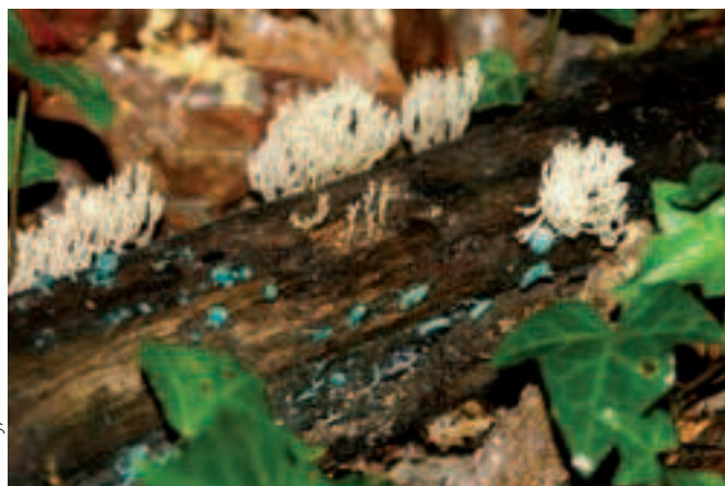
Artomyces pyxidatus et Chlorociboria (Ascomycète qui colore le bois en vert)