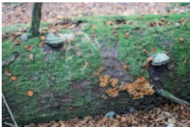
Fomitopsis pinicola en forme de console à marge blanchâtre et son successeur de couleur orangée Pycnoporellus fulgens