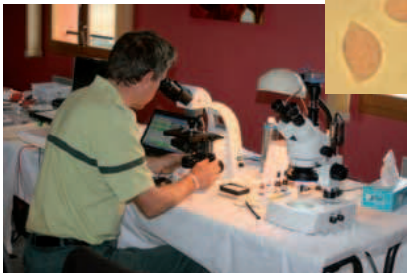
Détermination par examen microscopique en laboratoire ; spores bi-apiculées de Botryobasidium vagum , au grossissement 1000

Idéalement, l'objectif d'un inventaire mycologique en réserve biologique (ou dans tout autre espace relevant d'un tel investissement en études) serait d'obtenir une liste d'espèces de la zone considérée – ici la réserve biologique – la plus complète possible dans le cadre d'un état des lieux initial de la fonge, en vue de comparer cette liste à d'autres sites ou de la suivre dans le temps.