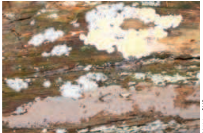
H. Voiry, ONF