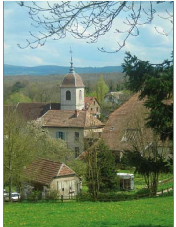
Photo 1 : quel avenir pour les espaces interstitiels ?

L'histoire de l'intercommunalité tend à montrer que les territoires de projet se constatent à l'issue d'une pratique de coopération et profitent alors parfois de cadres réglementaires pour s'organiser. Une création ex-nihilo , fut-elle sous-tendue par des partenariats plurinominaux (croisés), survivra-t-elle aux tensions internes et aux conflits d'intérêts ? Qu'en sera-t-il de la cohésion au sein de ce territoire de projet et du réseau d'acteurs une fois la LGV mise en service ? ■