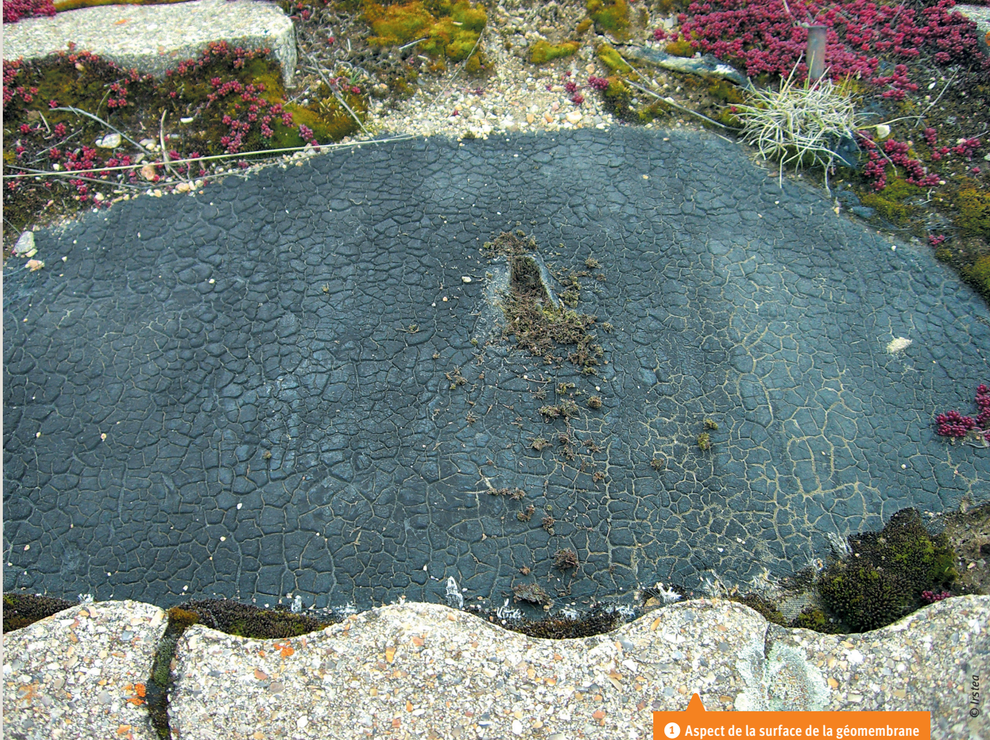
1 Aspect de la surface de la géomembrane du site 5 au moment du prélèvement.