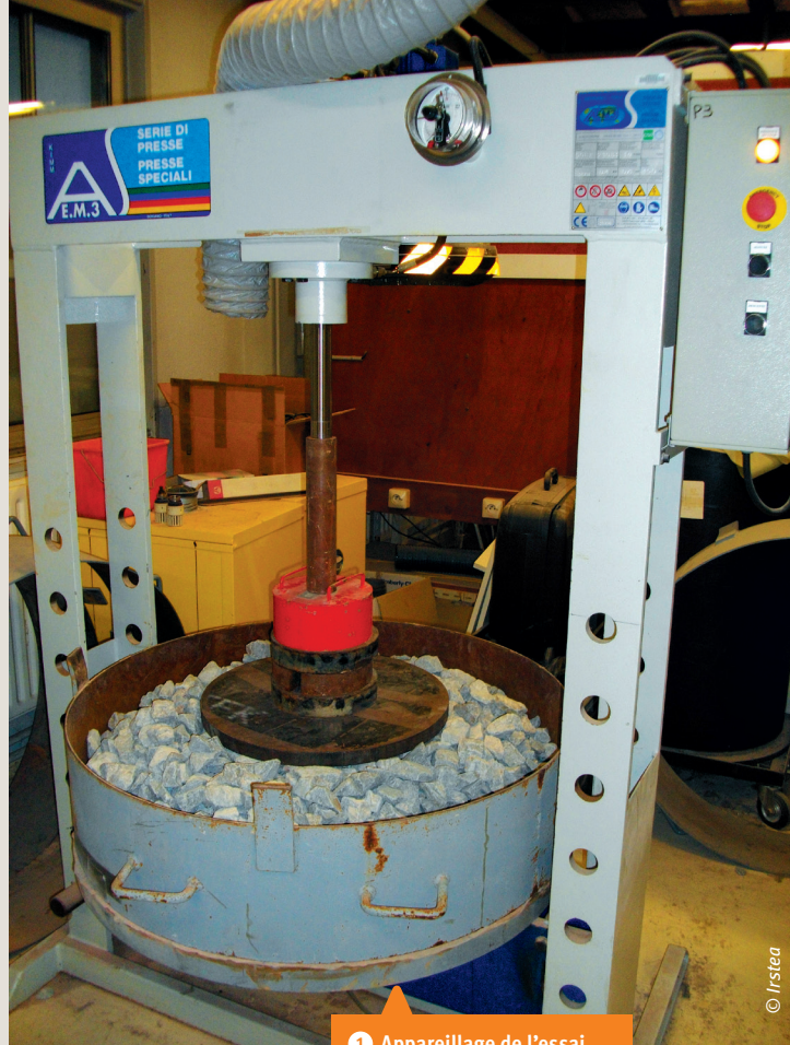
1 Appareillage de l'essai d'endommagement statique.

Onze géotextiles provenant de différents producteurs, et de masse surfacique annoncée égale à 1 000 g/m 2 ont été testés dans l'objectif de corréler la protection contre l'endommagement des géomembrane en PEHD à différentes