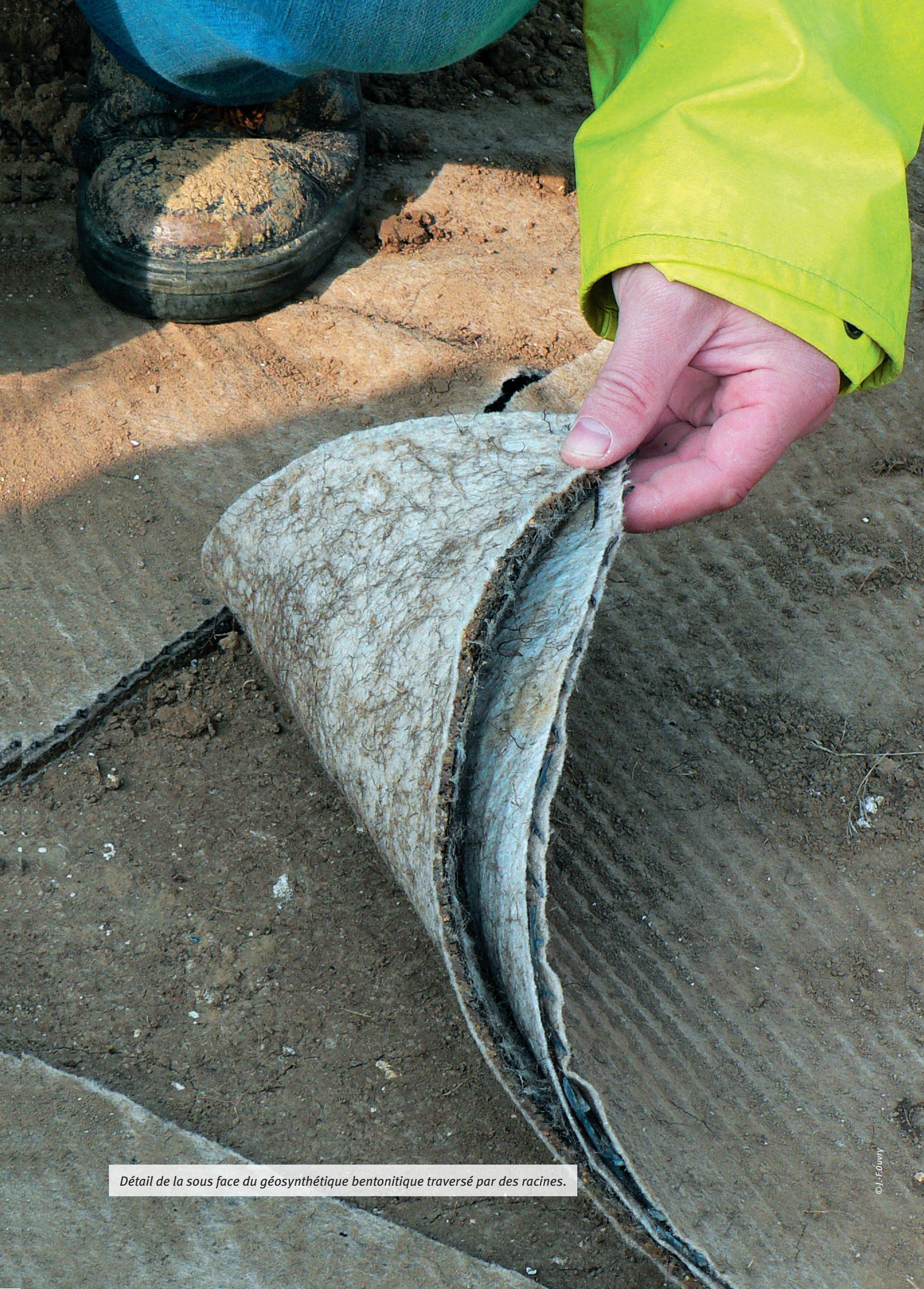
Détail de la sous face du géosynthétique bentonitique traversé par des racines.