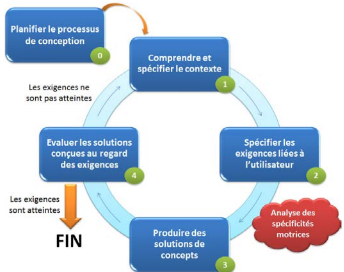
Fig.1. Modèle UCD tiré de la norme ISO 9241-210

physiques. Ensuite, nous proposons de choisir l'outil le plus adapté à l'utilisateur en fonction de son dossier. Pour ce choix, notre proposition est de combiner des modèles théoriques et des moyens technologiques afin de créer une bibliothèque d'outils. La prochaine étape est l'analyse des spécificités motrices. Elle s'exécutera, en fonction des outils sélectionnés sur mesure dans notre bibliothèque, à travers des interfaces dynamiques et innovantes. Les résultats sont enregistrés pour les traiter dans la dernière étape. Ils permettront de définir un « modèle de l'utilisateur » de ces capacités motrices. Ce modèle fournira des informations utiles pour la suite du processus de conception centrée sur l'utilisateur : produire des solutions de concepts (UCD-étape 3).