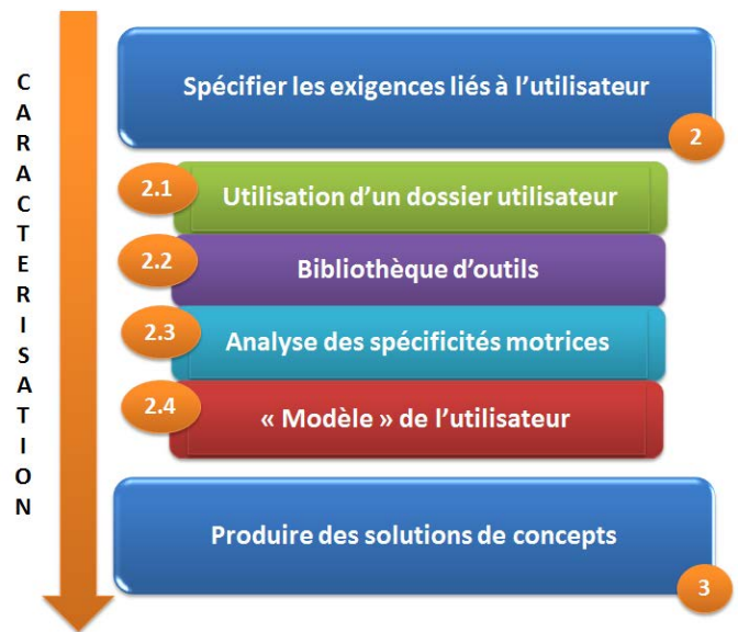
Fig.2. Proposition de quatre étapes intermédiaires