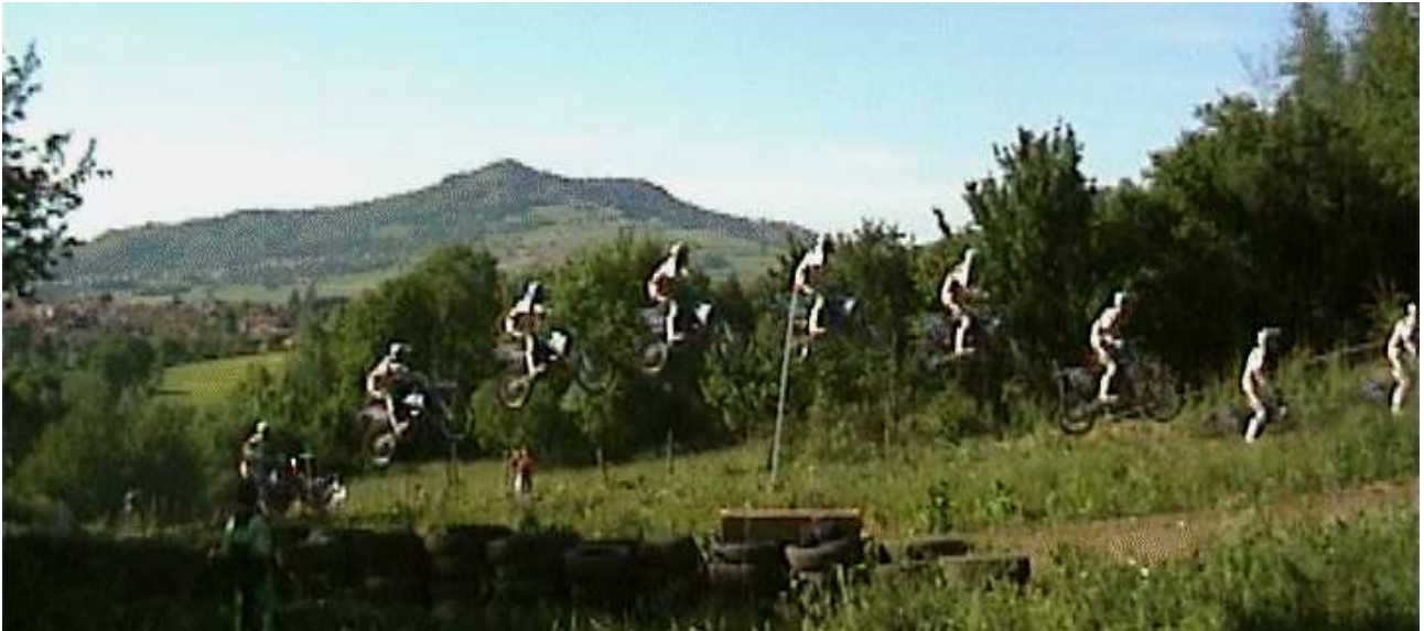
FIG. 1 – Vue générale des différentes phases d'un saut « normal » enregistré à 25 images/seconde.

Les masses de la moto, du casque et des bottes du pilote ont été mesurées et les positions de leurs centres de masse ont été déterminées en laboratoire par la méthode de la double suspension. Les masses du casque et des bottes ont été utilisées pour pondérer les masses et positions des centres de masse des segments tête, jambes et pieds dans le calcul du centre de masse ( G_P ) du pilote [2-4]. La masse et la position du centre de masse de la moto ( G_M ) ont ensuite été utilisées pour calculer la position du centre de masse ( G_\Sigma ) du système {Pilote + Moto}. Les moments d'inertie des roues avant ( J_{G1z} ) et arrière ( J_{G2z} ) et de la moto complète ( J_{GMz} ) ont également été calculés suivant la méthode du pendule pesant à partir de mesures d'oscillations effectuées sur des enregistrements vidéo numériques à 25 Hz. Toutes ces valeurs ont ensuite été utilisées dans le programme de simulation pour calculer le moment d'inertie total du système ( J_{G\Sigma z} ) et les variations d'orientation du châssis de la moto induites par les actions du pilote sur les commandes.