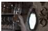
Fig.2 : "Celui qui buvait trop" (détail), Celui qui...

Le verre de bière dont l'artiste est amateur est un envers, l'envers du décor justement, et l'inverse du miroir. Ce dernier présente en son sein la lisse surface du reflet et son pourtour est éclatant, doré à l'or fin. Le demi, ce compagnon de déboires, cette moitié, présente une fragile transparence, une fragile surface ternie par l'éclat blond de la bière. Ce serait là cadre interné, liquéfié, cela dont on s'emplit pour sortir de ce qui nous enferme ; mais le cadre est ce sans quoi l'image de soi ne peut être contenue.