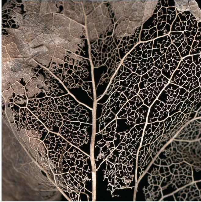
Fig.7 : "Regeneration 20", Régénération

On se tromperait pourtant en considérant ces haillons végétaux comme des peaux déliquescents, car à y regarder de très près, et la série nous y invite, l'appareil photographique faisant office de microscope, la peau est sur le squelette même, elle y reste accrochée, vivante, une pelure ineffaçable. Le vivant n'est pas dans l'oripeau mais dans sa colonne vertébrale tapissée d'une enveloppe secrète. La quête de Forsans est bien celle-ci : trouver l'enveloppe du corps et par là son unité qui s'est égarée dans l'alcool. Une peau et des racines, car que sont ces êtres fantoches qui déambulent plusieurs alors qu'ils devraient ne faire qu'un sinon des clones sans histoire, sortis de la trame de leur vie et de leur passé ?