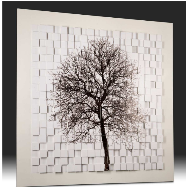
Fig.8 : "Regeneration", Régénération

Puisque l'alcool déstructure l'espace-temps le photographe a suivi le chemin de l'éparpillement en le maîtrisant, en livrant l'image de la décomposition. Le secret de son œuvre d'autoportrait nous est délivré enfin dans un travail qui ne relève pas apparemment du portrait. Forsans a créé un cliché, une photographie d'arbre, développée sur un carré de 1,20x1,20m, l'a divisé en 400 pièces montées sur des cubes de différentes hauteurs (Fig.8).