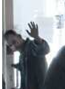
Fig.5 : "Celui qui buvait trop" (détail), Celui qui...

Dans le bar, les personnes ne sont que des personnages dont le signe authentique serait révélé par celui qui quitte les lieux, s'en allant vers la lumière. Mais on le sait, cet alcoolique repu, ne part que pour revenir sans avoir fait retour sur lui-même, sans retrouver une temporalité qu'il a noyée.