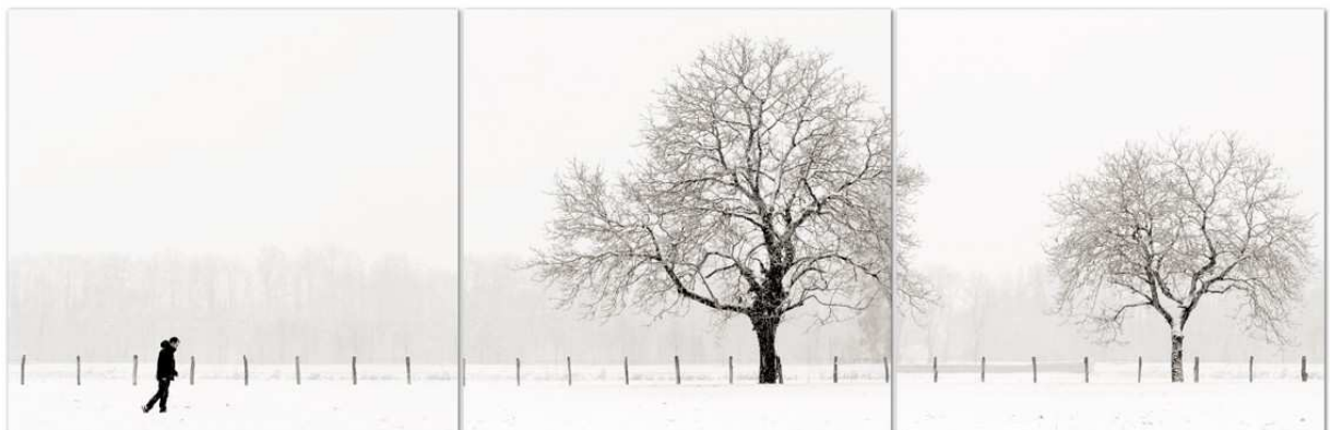
Fig.9 : "Regeneration 4", Régénération

Au-delà de la prouesse technique, il faut s'interroger pour finir sur les motifs d'une telle déstructuration spatiale. Est-ce une photographie en relief ? Ou, par la déstructuration de l'espace Forsans cherche-t-il à restructurer le temps ? Ce qui est décortiqué et reconstruit en tout cas, laisse à l'ombre l'espace pour se mouvoir, et exister, c'est l'occasion pour la temporalité de retrouver un itinéraire à habiter, et c'est ce qu'il fallait nous montrer.