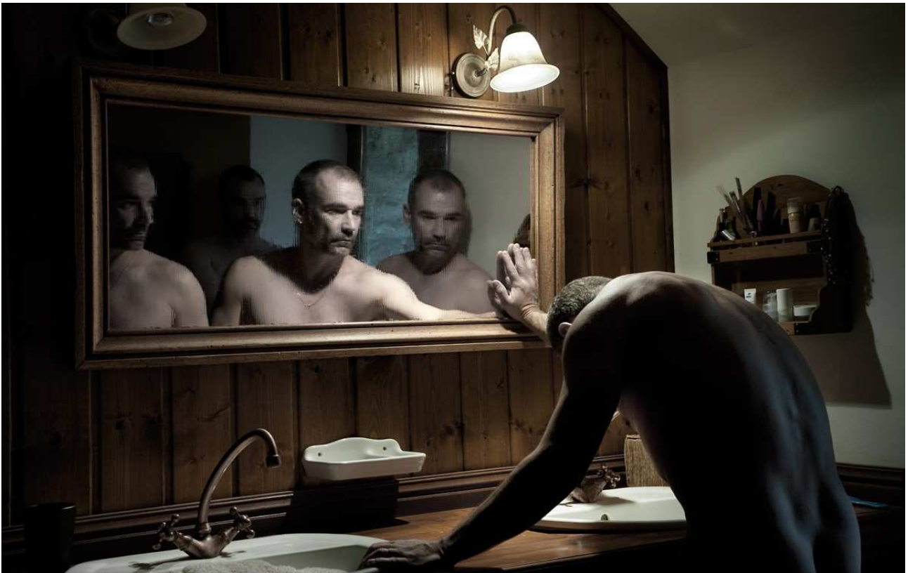
Fig.6 : "Celui qui ne se regardait plus dans la glace", Celui qui...