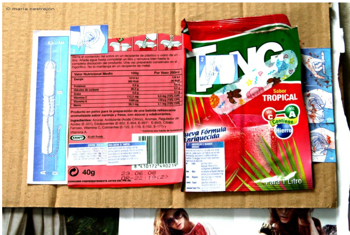
(collage de maríacastrejón)

Les premières règles estivales furent un véritable traumatisme. Ma mère, qui ne pouvait comprendre que sa fille, à cause du simple fait d'être une potentielle parturiente, doive se passer de ses plaisirs aquatiques, courut chercher une boîte de tampons. Sans explications, mais avec beaucoup de références dans mon œuvre longtemps après. Je reçus tous les stigmates dans cette salle de bain aux carreaux ornés de motifs floraux. Encore aujourd'hui, je continue de me demander qui peut bien poser la jambe sur la cuvette des toilettes pour se mettre un tampon.