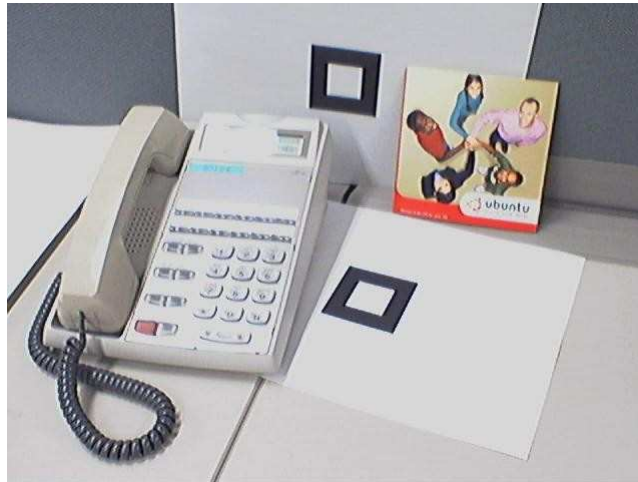
Figure 3 : marqueurs pour l'étape de calibration

“naturels” comme par exemple une pochette de CD. Il est en effet fréquent de trouver des carrés dans les scènes filmées. La difficulté sera alors de les repérer et de les identifier sur chaque caméra.