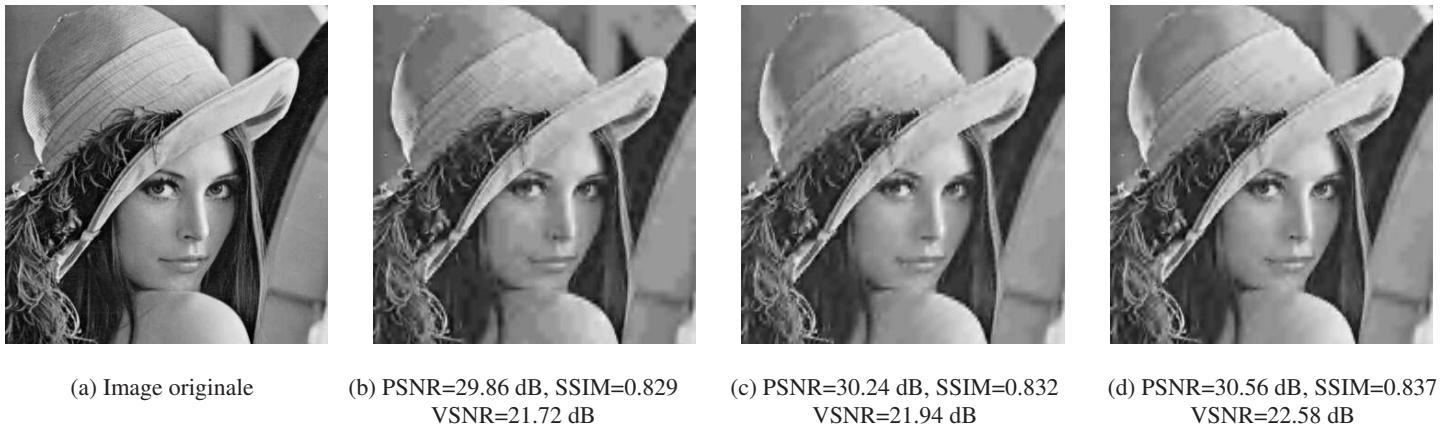
FIG. 2 – Images “lena” reconstruites à 0.125 bpp en utilisant (b) NSLS(2,2) (c) NSLS(2,2)-OPT-L2 (d) NSLS(2,2)-OPT-WL1.