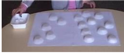
Figure 2- Une situation d'énumération

L'élève doit récupérer tous les sucres cachés sous les chapeaux, pour cela, il doit soulever un seul chapeau, prendre le sucre, le déposer dans la boîte et replacer le chapeau au même endroit (l'emplacement est marqué par une croix sur la feuille). S'il soulève un chapeau et ne trouve pas de sucre, il a perdu. Quand l'élève annonce qu'il a terminé, on enlève tous les chapeaux, si tous les sucres ont bien été trouvés, l'élève a gagné.