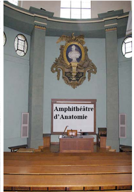
Fig. 4A. intérieur de l'amphithéâtre in Cours d'opérations de chirurgie démontrées au Jardin royal par Mr Dionis . Bruxelles 1708 (libre de droits). 4B. intérieur en 2009