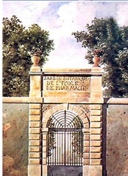
Fig. 6A. Plan de l'Ecole de pharmacie rue de l'Arbalète. On y remarque le tracé de la future rue Claude Bernard. 6B. Portail du Jardin botanique rue de l'Arbalète.

Chirurgie. Les candidats doivent acquitter des droits et faire des présents (argent, paires de gants...). L'art dentaire a réussi en quelques années à acquérir ses lettres de noblesse.