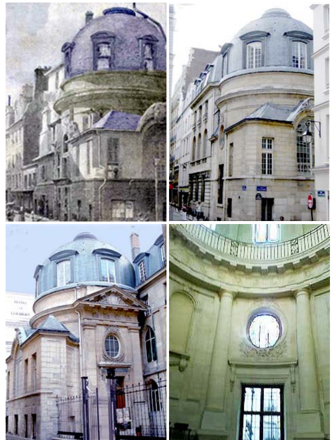
Fig. 2A. Amphithéâtre de Winslow, vue de la rue de l'hôtel Colbert (ex rue des Rats). Aquarelle de T. Masson 1855 (coll. perso. modifiée). 2B. Photo de 2009, peu de changements en 150 ans (Cliché J. Granat). 2C. Amphithéâtre de Winslow, vue de la rue de la Bûcherie. L'entrée est derrière les grilles (Cliché J. Granat). 2D. Amphithéâtre de Winslow vue de l'intérieur (Cliché J. Granat)