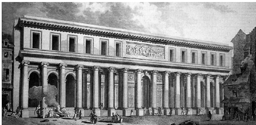
Fig. 5A. 1775, l'Académie royale de chirurgie par Jacques Gondouin, vue de la cour intérieure, B.N. modifié. 5B. façade donnant rue des Cordeliers. (cette œuvre est dans le domaine public)