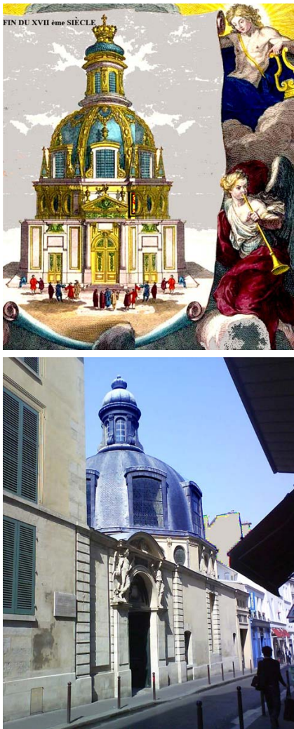
Fig. 3A. "Veüe de l'amphithéâtre anatomique de la Compagnie royale des chirurgiens de Paris" d'après une gravure de 1694 in Fonds anciens de BIUM et odontologie (modifié). 3B. Vue en 2009, rue de l'école de médecine ex rue des Cordeliers (Cliché J.Granat)