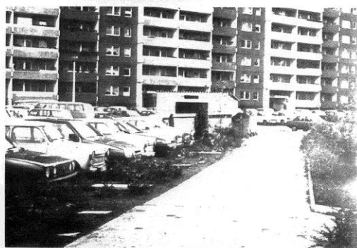
Bild oben: Eichhorster Straße - "vermüllte" und verwahrloste Hauseingänge Bild mitte: Eichhorster Straße - dito Bild unten: Rosenbecker Straße 5/7 - die Container stehen vor dem Müllhaus

Extrait du rapport d'étape sur la participation des habitants dans le cadre de la Plattform Marzahn, compte rendu de la visite du quartier de Marzahn Nord du 23 novembre 1991, in Weeber+Partner 1992, p. 39 9