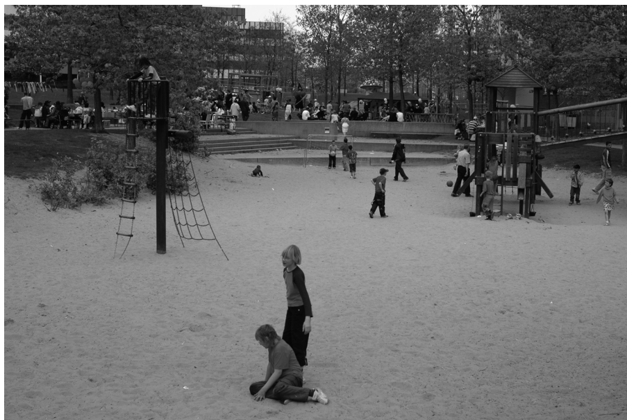
Fête d'immeuble organisée par l'association du « Café de la Tour », Marzahn Nord, avril 2005

La photographie ci-dessus représente la cour d'un immeuble situé dans le quartier nord du grand ensemble de Marzahn à Berlin-Est (se reporter à la carte ci-après). Elle a été prise en 2005 pendant une fête de quartier. Les animations proposées aux familles du voisinage investissent l'ensemble des espaces collectifs des immeubles. Ce mode d'inscription spatiale de la sociabilité familiale distingue les familles populaires des autres catégories sociales qui habitent ce grand ensemble et contribue à lui donner une ambiance « populaire ».