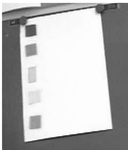
Figure 3. Le tableau du vote préparé à l'avance par la maîtresse

Or la maîtresse n'exploite aucunement cette disposition. Elle n'en remarque pas les propriétés. Elle ne leur demande pas de la traduire en mots. Elle ne la rappelle pas au moment de remplir le tableau préparé à l'avance (figure 3). Bien au contraire, elle la détruit pour reformer le tas de tous les bulletins, pensant alors légitimer le recours à l'écriture des nombres dans le tableau.