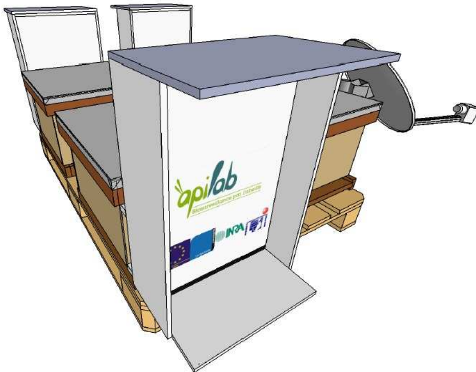
Figure n°1 : vue d'ensemble d'un rucher expérimental constitué de 3 ruches chacune équipée avec un compteur d'abeille par vidéosurveillance

Le compteur d'abeille peut-être installé sur des ruches de type Dadant comme représenté dans la Figure n°1 ci-dessous. Il est équipé d'une caméra couleur qui enregistre en continu une vidéo de la planche d'envol. Les images sont récupérées, stockées dans un ordinateur embarqué et analysées grâce à des algorithmes de comptage et d'alerte. Les données peuvent ensuite être transmises sous format Excel via les réseaux GSM (Global System for Mobil Communications), internet ou satellite et être interprétées afin de produire des rapports journaliers comme celui présenté ci-après.