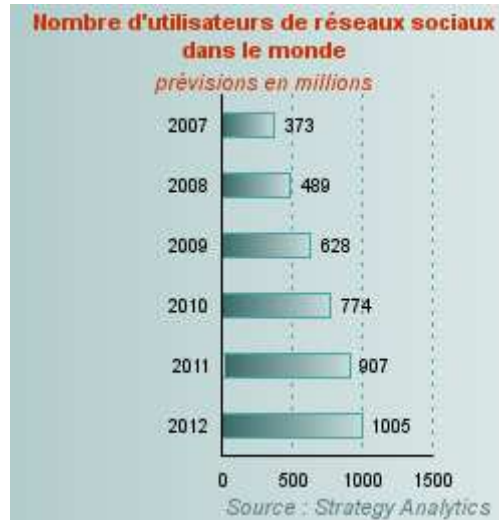
Figures 3 : Prévisions du nombre d'utilisateurs de réseaux sociaux dans le monde

Pour un sociologue des médias, il devient donc légitime de s'interroger sur ce phénomène qui n'est pas juste un phénomène occidental, car Facebook comptait plus de dix neuf millions d'utilisateurs pour le continent Africain en octobre 2010 (soit un taux de pénétration de plus de 18%).