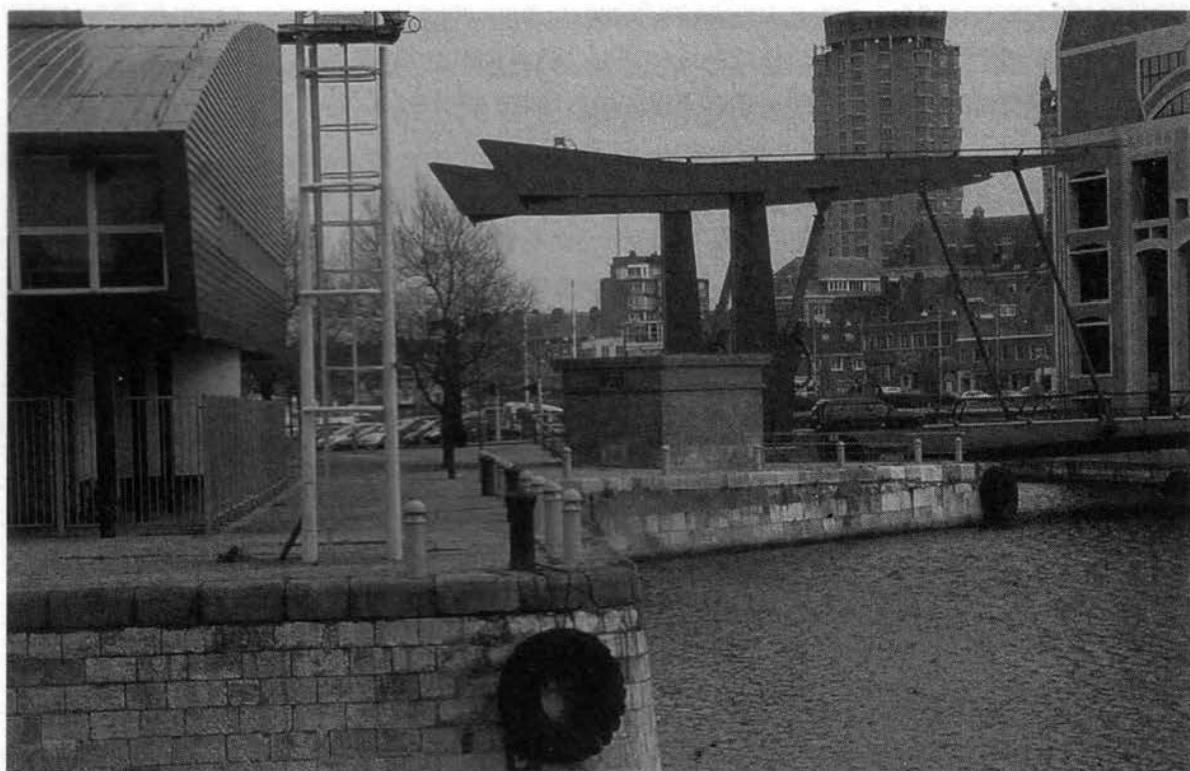
Le pont de R. Rogers.

véritables « murailles » en front à quai, qui isolent du port les tissus en retrait. Le tout récent projet du Grand Large prolonge d'ailleurs ce principe. L'avenir nous dira si la future « densification » de la Citadelle prêterait attention aux perméabilités visuelles existant aujourd'hui entre le centre-ville et les darses.