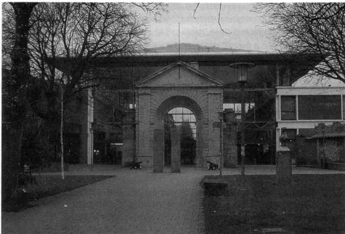
Le Centre Marine.