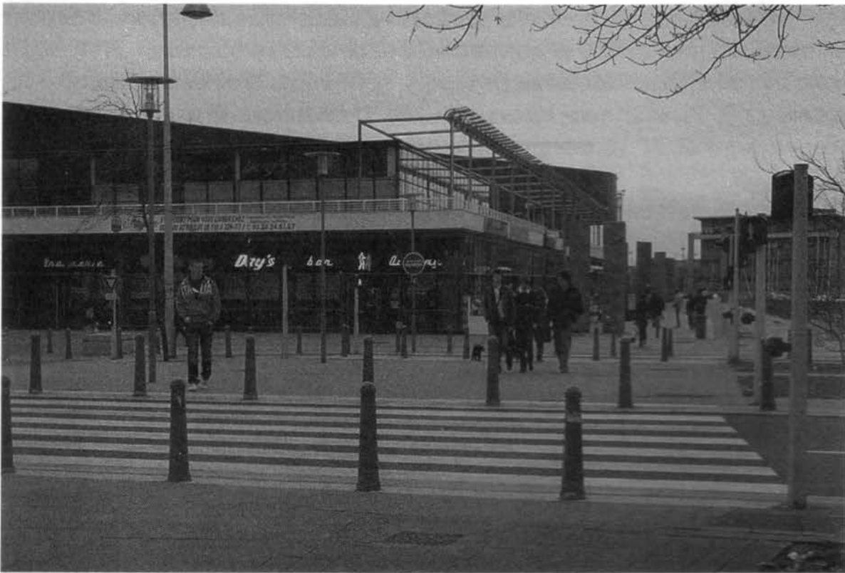
Le Pôle Marine.