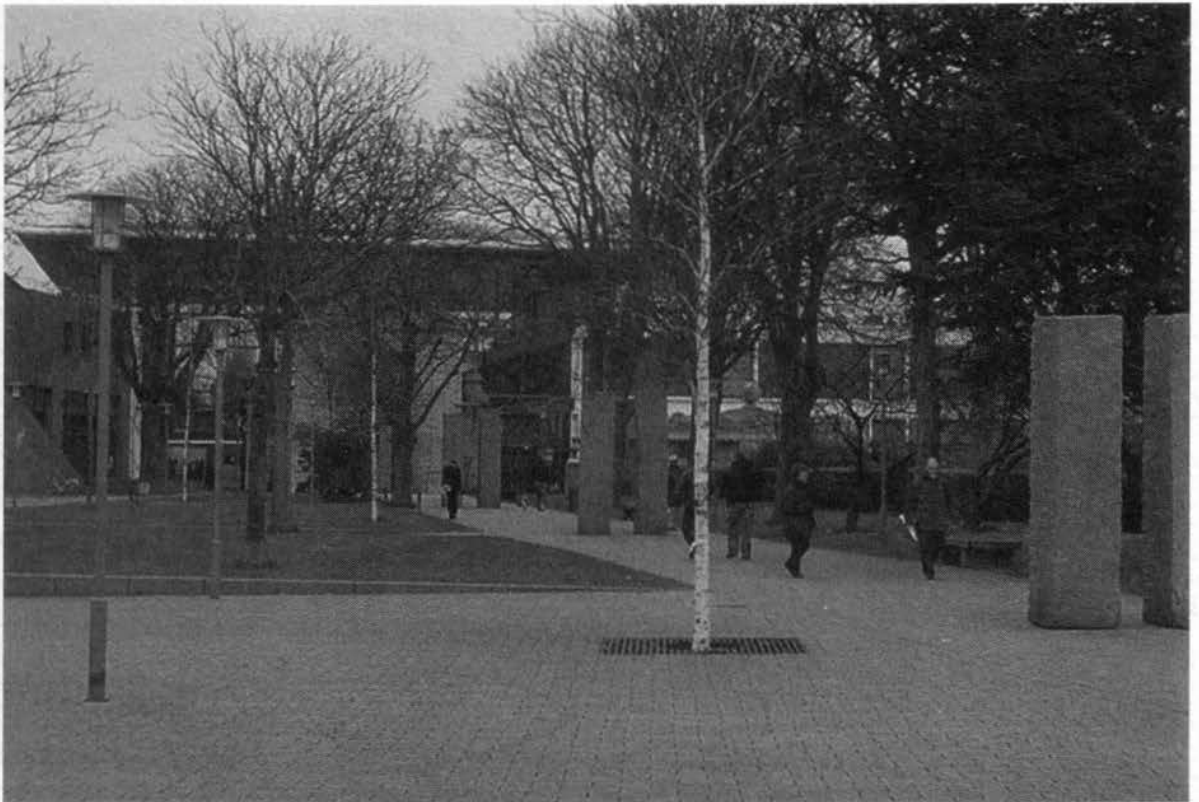
Les colonnes de R. Nonas.

Par exemple, moi si je vais en ville, je ne vais pas au pôle marine. Par contre si je vais au pôle marine, je ne vais pas au centre-ville, je ne relie pas les deux trucs.