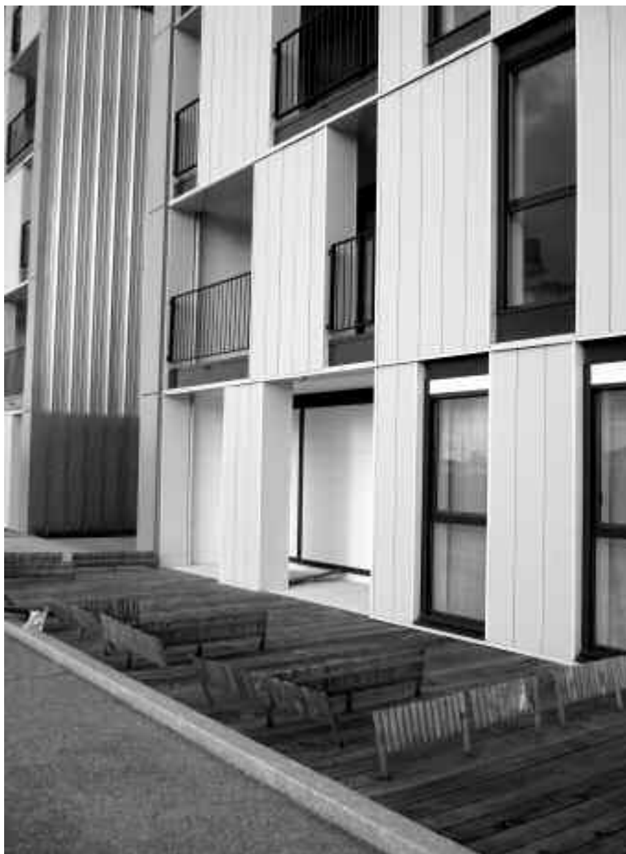
Photo 3 – Clôture illégale de terrasse privée