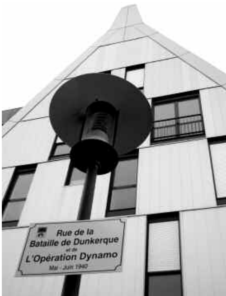
Photo 1 : Immeuble à gable et valorisation mémorielle

personnages qui avaient marqué cette épopée ouvrière, mêlés aux grands hommes du siècle dernier (Mandela, Malraux, Dreyfus...), les nouveaux arrivants de Grand Large ont donc pour mission « d'incarner le renouveau du site des Chantiers de France 9 ». Cependant, il aurait fallu que cette grammaire historique fût progressivement formalisée, puis largement répandue de sorte qu'elle soit aujourd'hui disponible pour les habitants et qu'ils puissent la revendiquer. Or, cette volonté mémorielle toute récente est allée à contre-courant de tout le travail de déni réalisé depuis la démolition quasi-totale de la NORMED 10 .