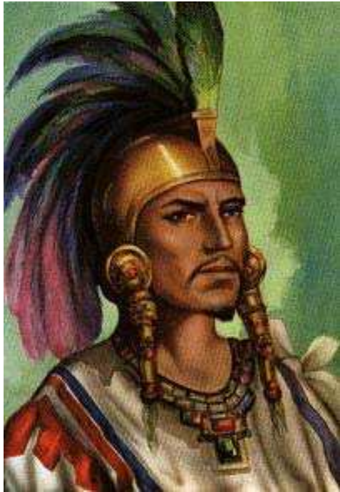
Cuauhtémoc: ejemplo de la representación del indígena histórico

Ahora bien, en el área de interés de este manuscrito, ¿cómo podemos articular la discusión anterior con la construcción de sentidos sobre el ser indígena, codificados textual e icónicamente? Flores (Flores 2007) hace una revisión de lo que podríamos considerar los primeros códigos que dan sentido a la producción de imágenes como forma de conocimiento sobre poblaciones “nativas”. Estudia el conocimiento generado desde la antropología británica y su rol en la creación de imaginarios visuales a propósito de las regiones y sujetos colonizados (ibid: 66). También revisa el código de los imaginarios poscoloniales latinoamericanos donde los indígenas aparecen vinculados a ideologías de construcción de lo