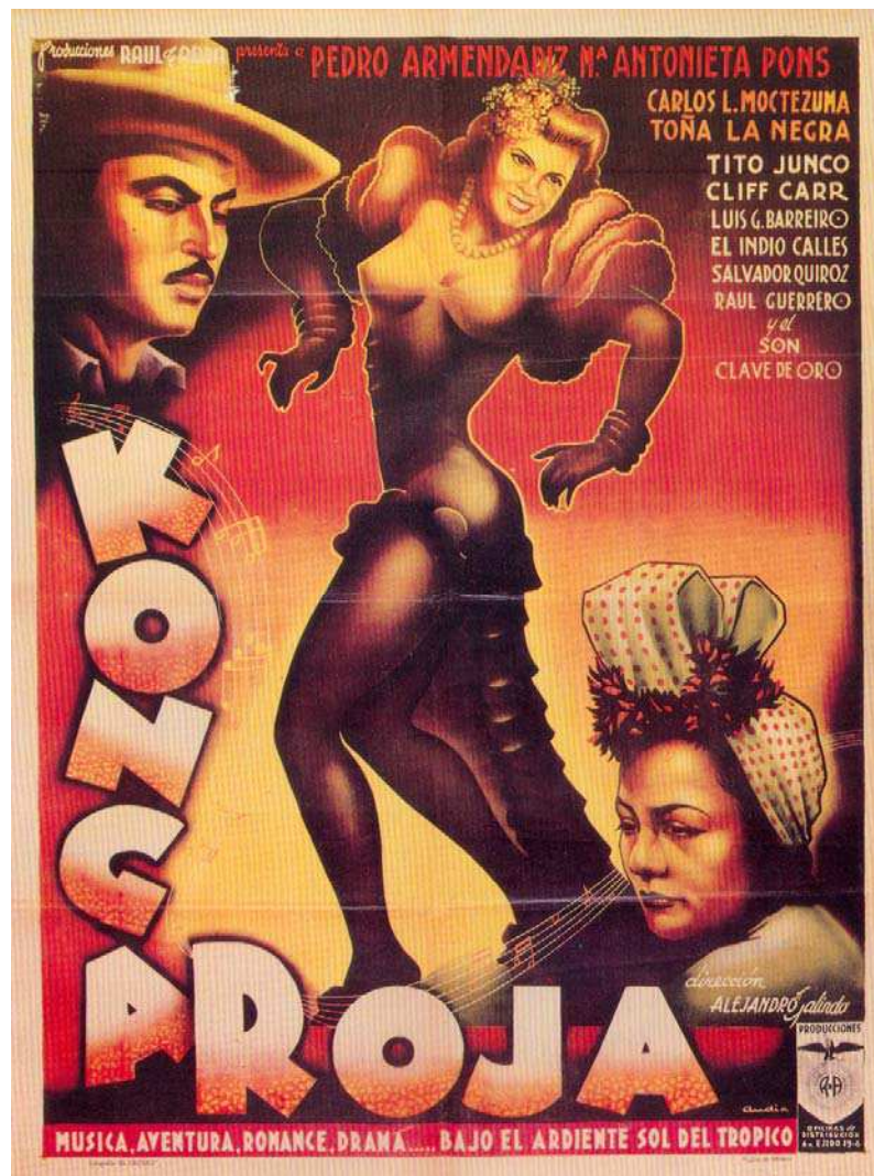
Konga Roja (Alejandro Galindo, 1953).

El cine mexicano de los años 1930 a 1950, acogió a las mulatas y a los negros como personajes que adquirieron una considerable popularidad. Se aprecia su tránsito por los escenarios cinematográficos en argumentos, canciones, ritmos, hasta en la creación del conocido “cine de las rumberas.” Este último dio cabida a ambos tipos populares. Tras este fenómeno de asimilación cultural, la industria cinematográfica en México se desbordó en la construcción de personajes con los que se aludió al trópico y que si bien describieron aspectos del mestizaje, no dejan de ser, a ojos del espectador, referencias a “lo ajeno”.