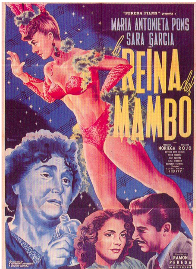
La reina del trópico (Raúl de Anda, 1945)

narran el mestizaje mulato: el estereotipo ya formado. Unas en la apariencia fabricada de la mujer blanca cuyo cuerpo, comportamiento y vestido hablan más que el tono de piel, 18 otras que en el tono de piel llevan el estigma o la fortuna de representar su origen antillano.