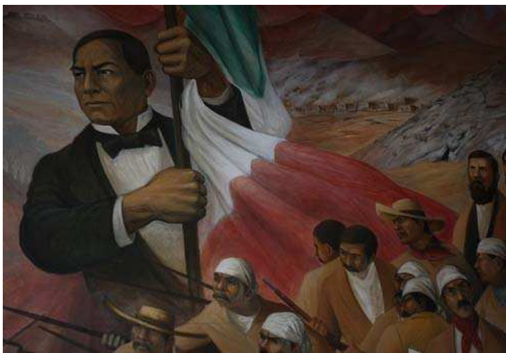
Benito Juárez: ejemplo de la representación del indígena defensor de la soberanía nacional: ganó contra el intento de invasión de los franceses.

Ahora bien, en el área de interés de este manuscrito, ¿cómo podemos articular la discusión anterior con la construcción de sentidos sobre el ser indígena, codificados textual e icónicamente? Flores (Flores 2007) hace una revisión de lo que podríamos considerar los primeros códigos que dan sentido a la producción de imágenes como forma de conocimiento sobre poblaciones “nativas”. Estudia el conocimiento generado desde la antropología británica y su rol en la creación de imaginarios visuales a propósito de las regiones y sujetos colonizados (ibid: 66). También revisa el código de los imaginarios poscoloniales latinoamericanos donde los indígenas aparecen vinculados a ideologías de construcción de lo