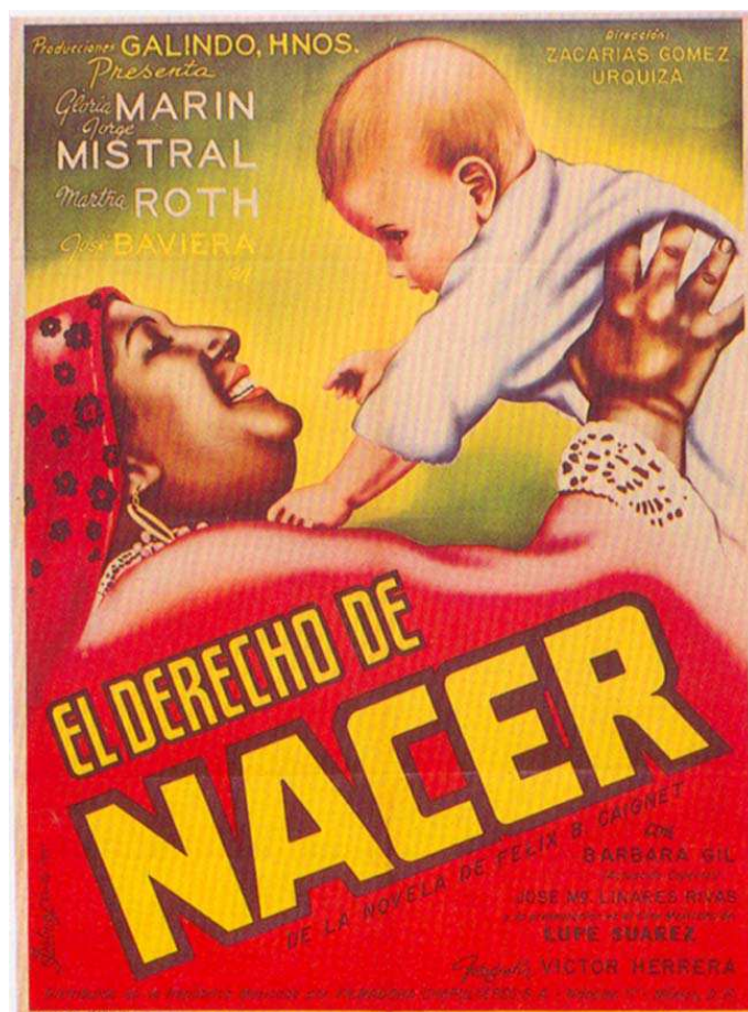
Derecho de nacer (Zacarias Gómez, 1951)

representativos de la vida social insular. Ya en la radio, en programas como El derecho de nacer y La tremenda corte , estos mismos personajes harán lo propio en otro soporte. Aunque en términos de diseño del personaje resultan parecidos y en algunos casos hasta idénticos.