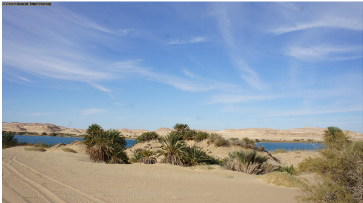
Photo 8 : Quelques palmiers féral de l'oasis antique abandonnée de Shiyata, entre Siwa et la frontière libyenne, le 19 octobre 2011