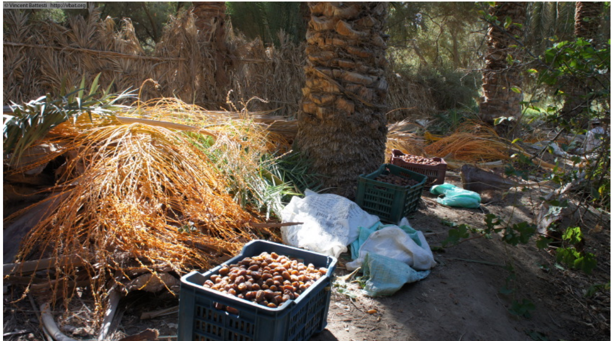
Photo 1 : Récolte des dattes (dattes saïdi dans le cageot) dans un jardin de Siwa, à Taturbant (quartier de palmeraie), le 4 novembre 2010