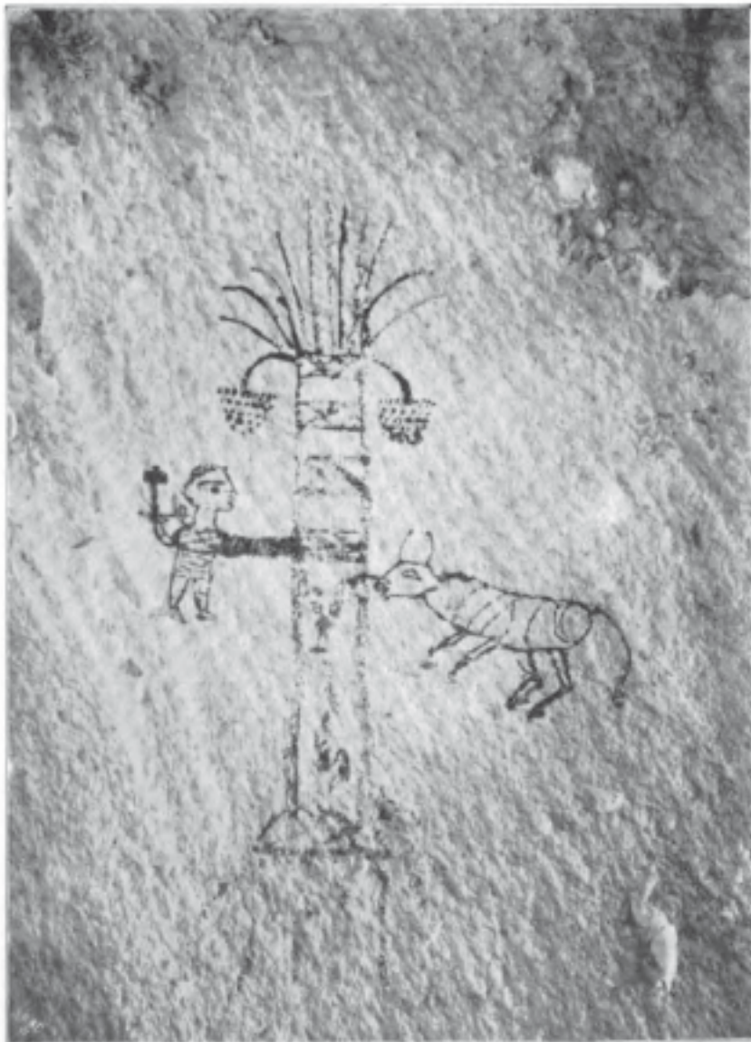
Abb. 92. Wandbild in einem Felsenkammer in Tassili n'Ajaj. (Zu Seite 136.)

recolonisé la place se sont trouvés à la tête d'un stock génétique important, notamment de cultivars de dattier donc sans nom pour partie et pour une autre de dattiers ensauvagés (félals).