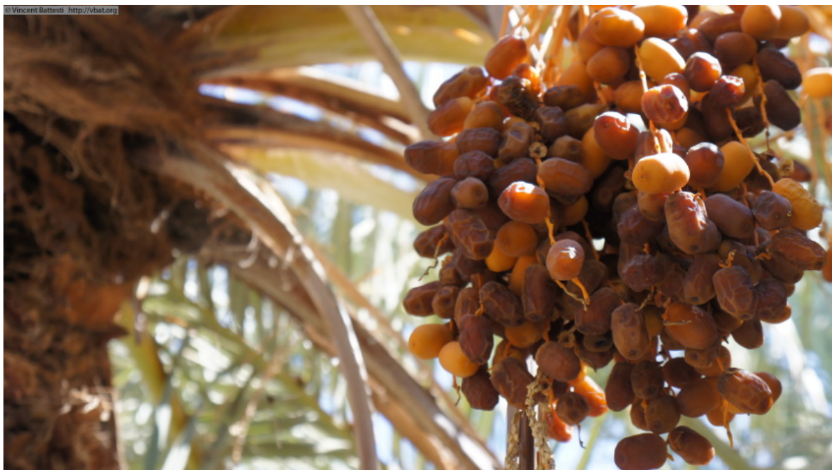
Photo 5 : Régime de dattes šaēidi sur un tasutet , prêt à être coupé, à Juba (quartier de palmeraie), le 12 octobre 2001