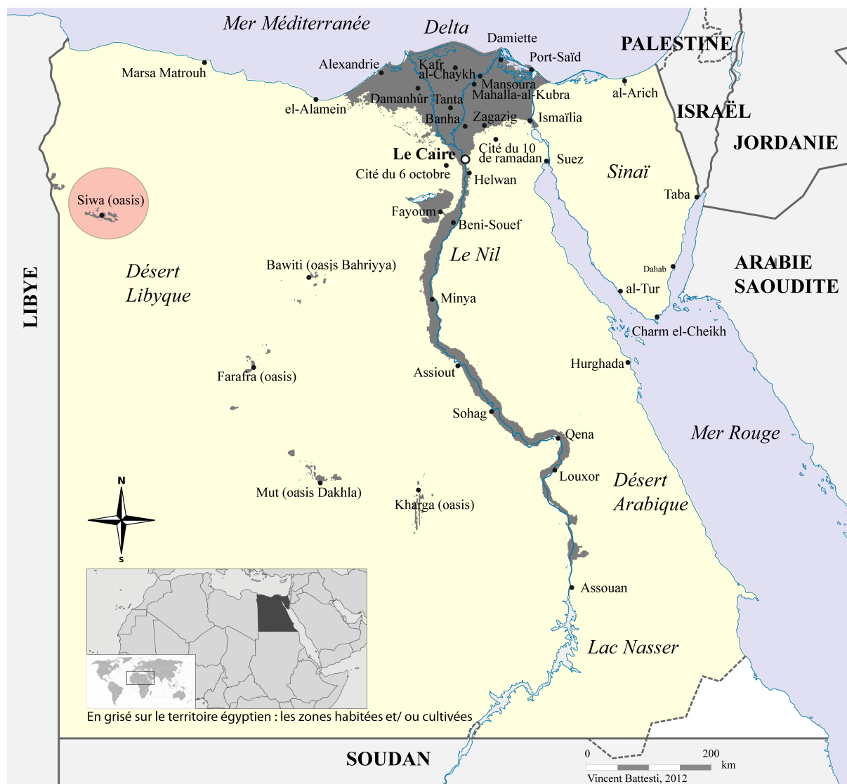
Figure 1 : Carte de situation de l'oasis de Siwa en Égypte

dans), « innombrables », car ces services de l'Agriculture sont incapables d'en fournir un chiffre et par ailleurs les droits de propriétés ne sont que rarement enregistrés à l'administration (un contrat visé par le pouvoir local prévaut sur l'étatique). La palmeraie est le centre de l'activité oasienne, des millions d'heures de travail sont investies là chaque année, de passions aussi, de discussions, d'argent. (Battesti 2006b: 157-158). La population au dernier recensement de 2006 était de 22 000 habitants (Capmas 2006).