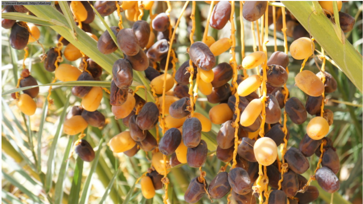
Photo 7 : Régime de dattes du cultivar úšik niqbel, mûres pour partie d'entre elles, dans le quartier de palmeraie Qotta, le 14 octobre 2011