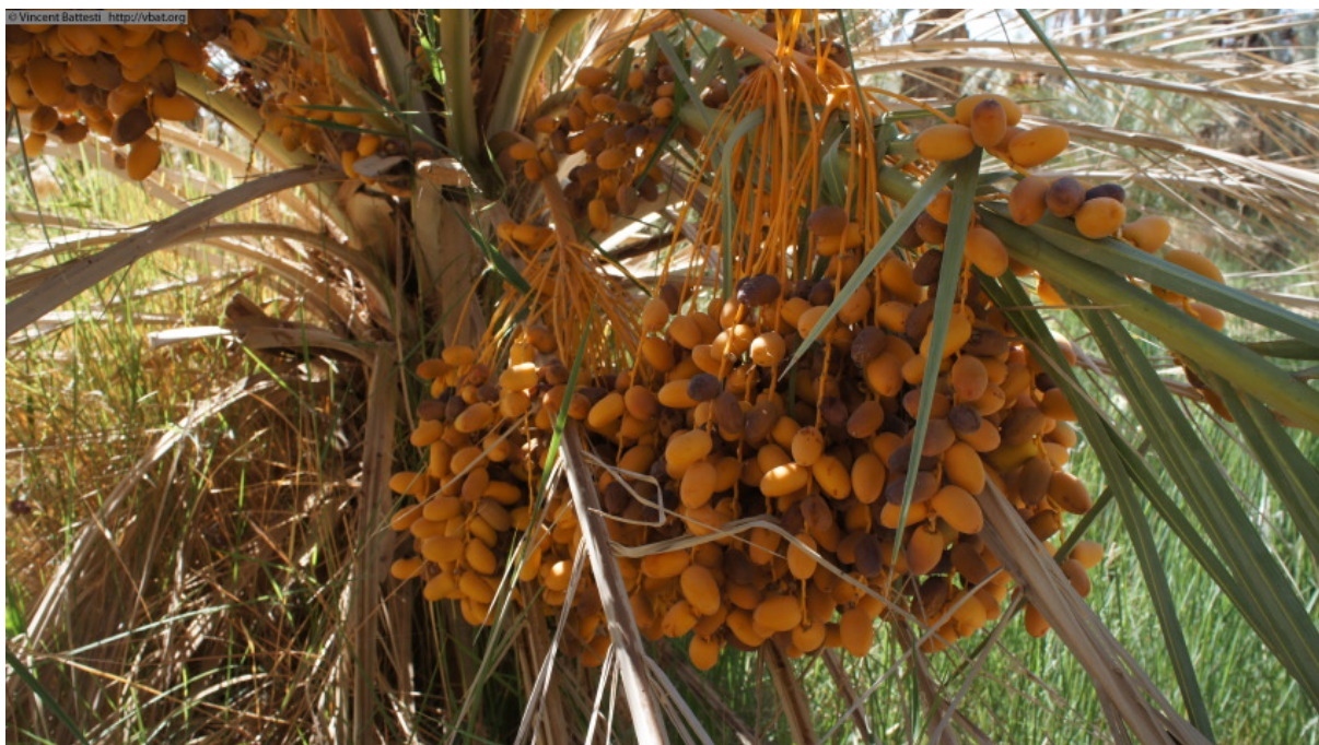
Photo 6 : Régime de dattes du cultivar γrom ayzâl , seulement à moitié mûres, dans un jardin peu entretenu de Melul, le 13 octobre 2011