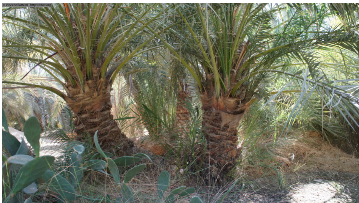
Photo 2 : Trois rejets d'un pied mère (disparu) de cultivar úšik am ayzuz dans un jardin du quartier de palmeraie Tamusi, le 13 novembre 2011