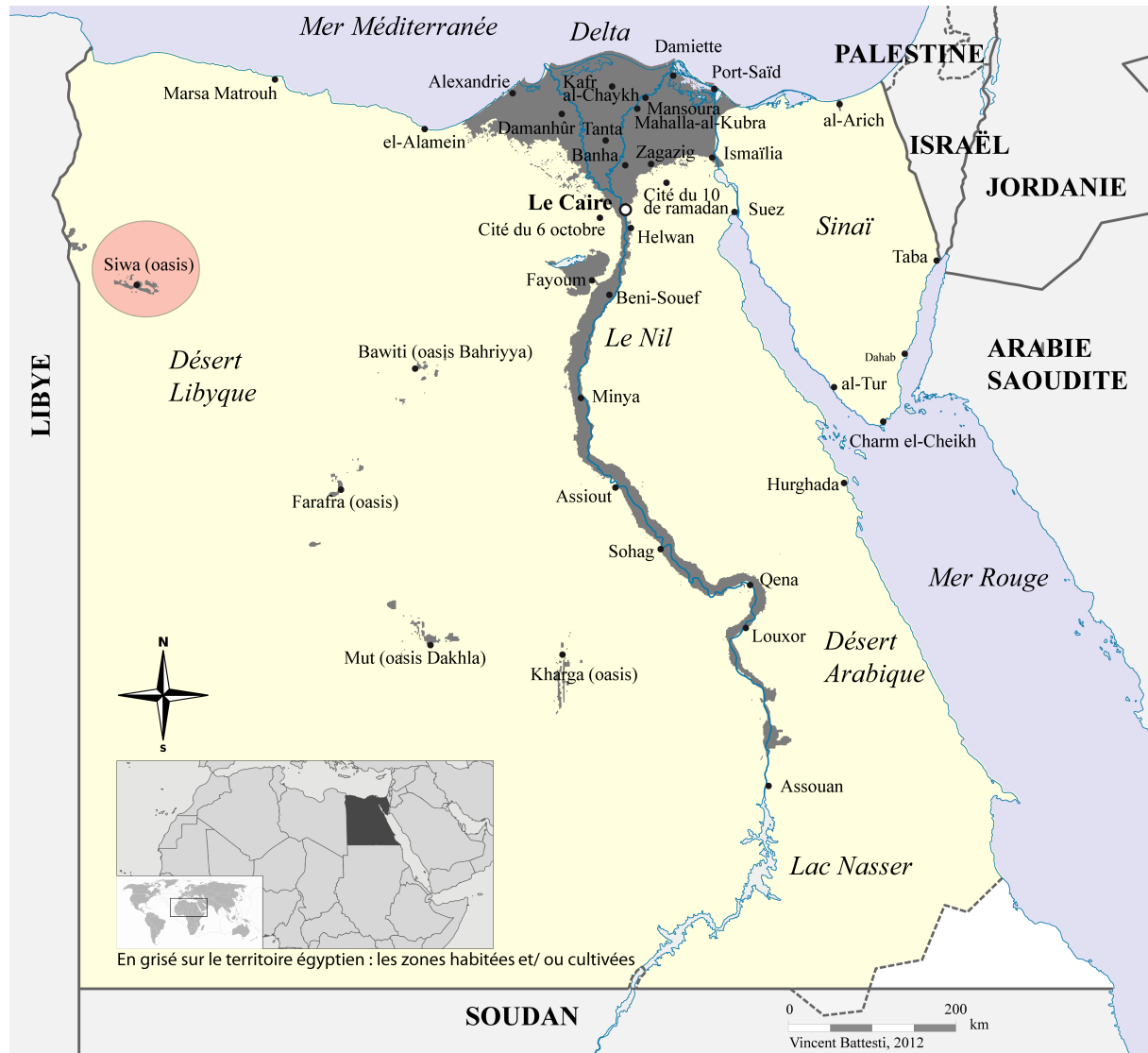
Figure 1 : Carte de situation de l'oasis de Siwa en Égypte

dans), « innombrables », car ces services de l'Agriculture sont incapables d'en fournir un chiffre et par ailleurs les droits de propriétés ne sont que rarement enregistrés à l'administration (un contrat visé par le pouvoir local prévaut sur l'étatique). La palmeraie est le centre de l'activité oasienne, des millions d'heures de travail sont investies là chaque année, de passions aussi, de discussions, d'argent. (Battesti 2006b: 157-158). La population au dernier recensement de 2006 était de 22 000 habitants (Capmas 2006).