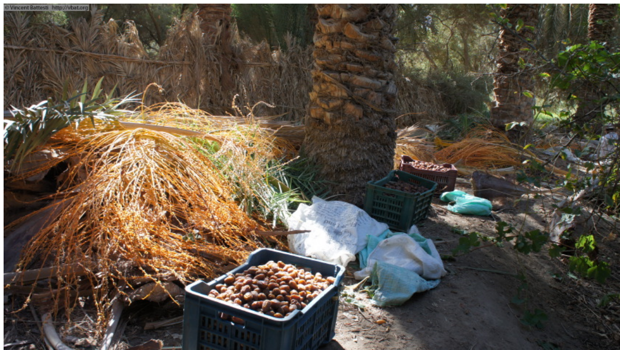
Photo 1 : Récolte des dattes (dattes saïdi dans le cageot) dans un jardin de Sixa, à Taturbant (quartier de palmeraie), le 4 novembre 2010