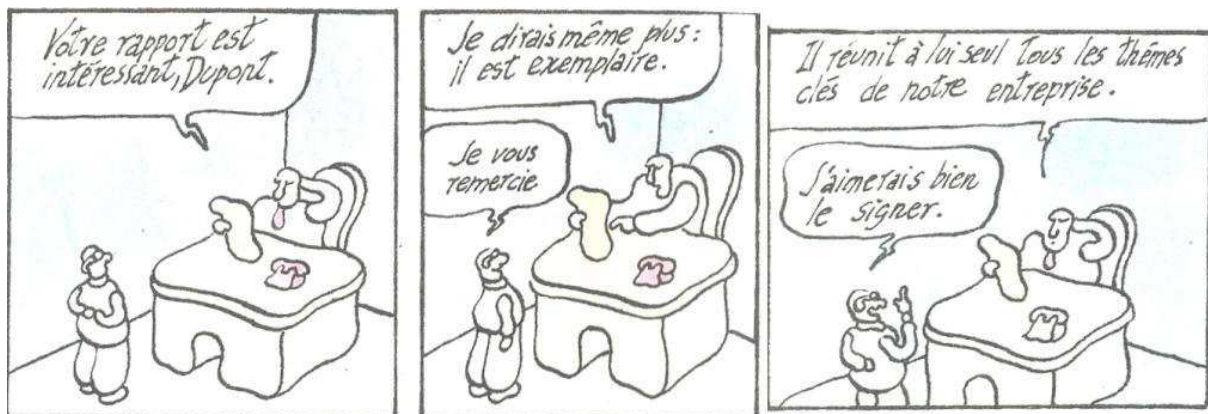
Figure III. Sergueï, La vie héroïque et exemplaire de l’employé de bureau, 1987 : 10.

Le récepteur d’un document administratif ne peut pas, non plus, déterminer qui lui écrit puisque les mécanismes de production du texte administratif neutralisent les ancrages des instances successives. Le texte devient un conglomérat scriptural insituable, souvent pour des raisons de positionnements hiérarchiques, et d’agencement de l’institution en bureaux. Or, pour Austin par exemple, « l’équivalent de ce lien à la source dans les énonciations écrites est simplement évident et assuré dans la signature » (Derrida 1972 : 391). Pour Ricœur, aussi bien, « l’acte de signer implique un