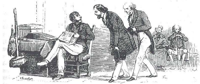
Figure V. Les Français peints par eux-mêmes , 1841 : « Le garçon de bureau ».

« L’effet bureau » est en effet caractéristique d’une genèse historique mais aussi modèle théorique de tout fonctionnement de bureau dans un agencement institutionnel : au départ, une assemblée de gens liée à des fonctions et des identités multiples (travail à l’usine, citoyenneté, résidence dans le quartier, etc.) puis un « bureau » qui « représente » ces gens pour chaque fonction (c’est la délégation), puis la confiscation de l’autorité et de la légitimité de parole au profit du seul Bureau dans un lieu séparé. Marc Ferro analyse ainsi cette progressive préemption de la « parole représentée » comme l’une des marques initiales de la « bureaucratisation » des soviets de Russie en 1917 : dès lors que, « dans les quartiers, les citoyens ont perdu le droit à la parole : le Bureau devient le seul émetteur » (Ferro 1976 : 256). Si cette genèse n’est pas aussi visible dans