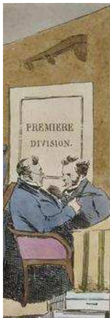
Figure 1. Monnier, Mœurs administratives , 1828, détail lithographique de Delpech.

« - Quel pouvoir a-t-il sur toi, ce torchon barbouillé par un obscur plumitif, sur toi qui es bien vivant et libre ? Quelle prise cela peut-il avoir sur toi ? - Pas la feuille, celui qui l’envoie. [...] - Un employé aux écritures ! Un rond-de-cuir qui s’ennuie ! » (Zweig 1919 : 117-118)