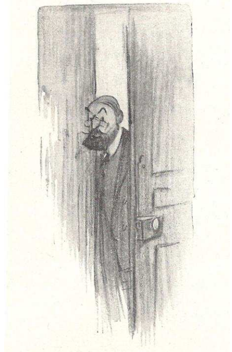
Figure IV. Courteline, Messieurs les ronds de cuir , 1908, Illustr. Poulbot.

« ...de vous informer que nous nous proposons de procéder prochainement à des essais de vessies à glace dans les conditions normales d'utilisation. Nous vous serions reconnaissants de bien vouloir nous faire