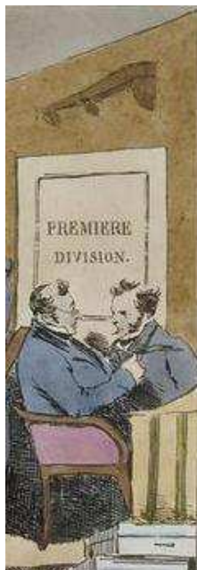
Figure 1. Monnier, Mœurs administratives , 1828, détail lithographique de Delpech.

« - Quel pouvoir a-t-il sur toi, ce torchon barbouillé par un obscur plumitif, sur toi qui es bien vivant et libre ? Quelle prise cela peut-il avoir sur toi ? - Pas la feuille, celui qui l’envoie. [...] - Un employé aux écritures ! Un rond-de-cuir qui s’ennuie ! » (Zweig 1919 : 117-118)