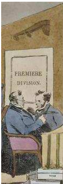
Figure 1. Monnier, Mœurs administratives , 1828, détail lithographique de Delpech.

« - Quel pouvoir a-t-il sur toi, ce torchon barbouillé par un obscur plumitif, sur toi qui es bien vivant et libre ? Quelle prise cela peut-il avoir sur toi ? - Pas la feuille, celui qui l’envoie. [...] - Un employé aux écritures ! Un rond-de-cuir qui s’ennuie ! » (Zweig 1919 : 117-118)