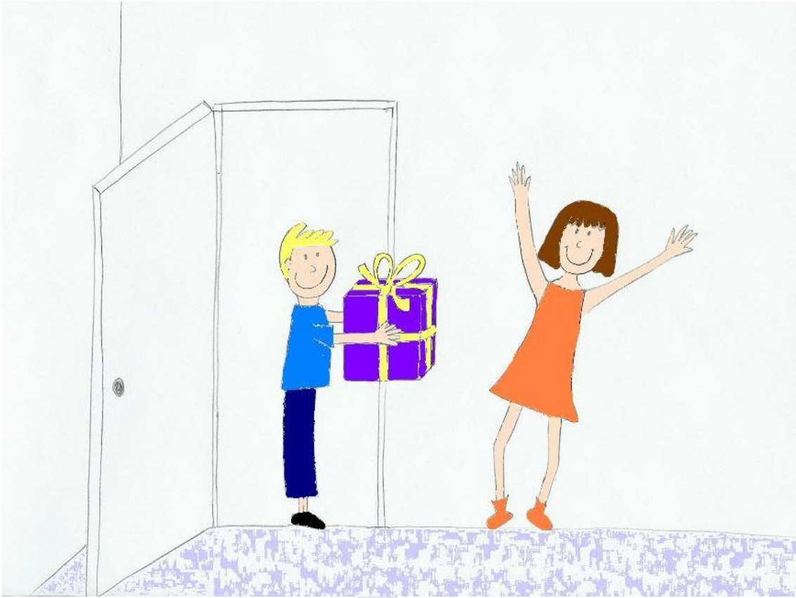
Figure 1. Exemple d'une partie du scénario « joie » : le personnage vit une émotion positive