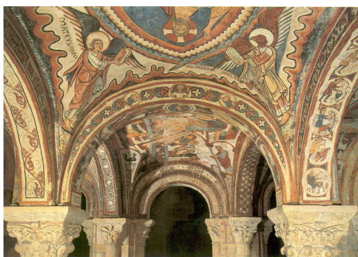
Fig. 1 : Panthéon de Saint-Isidore de León - Vue d'ensemble.