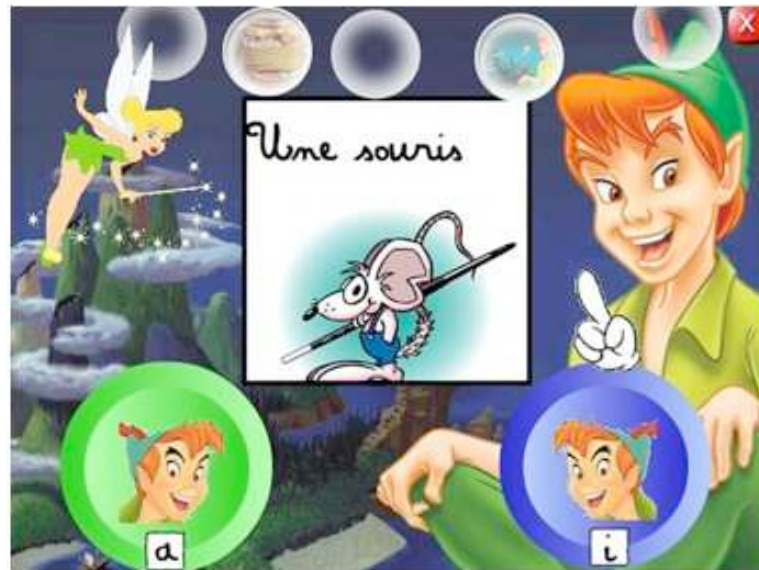
Figure 1 • Exercice de Français

Pour l'exercice de mathématiques (Figure 2 ci-dessous), les enfants perdus, ainsi que Wendy, Jean et Michel ont été kidnappés par le Capitaine Crochet. Ils ont été attachés au mat du bateau des pirates.