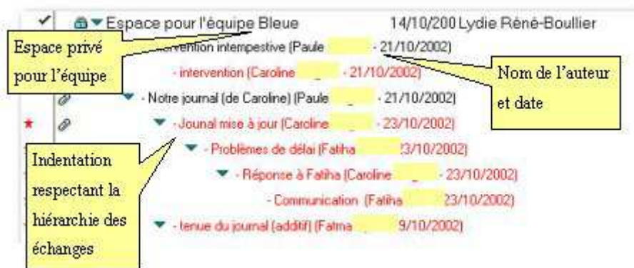
Figure 2 : Travail collaboratif par le forum asynchrone

Le suivi du forum permet de voir si tout le groupe participe régulièrement. Les outils offerts nous convenaient puisqu'il était bien question de prendre en charge nos étudiants, de les suivre, de les contrôler et de les aider au moment où la motivation pouvait baisser. Il était donc essentiel de pouvoir suivre le travail de chacun [4] .