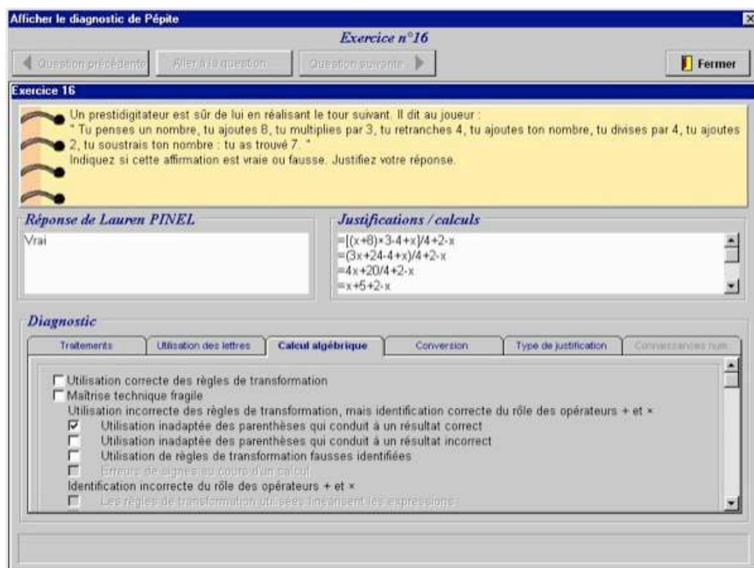
Figure 2: Le diagnostic automatique de Pépite sur 6 dimensions, modifiable par un évaluateur humain.

plus haut niveau sur l'activité de l'élève, le profil cognitif est construit en cumulant, sur l'ensemble des exercices les codes identiques ou en associant ou opposant certains codes. La méthode de cumul et d'association des critères est fondée sur une expertise didactique. Ce profil est exprimé par des taux de réussite, par les points forts et points faibles sur trois dimensions (usage de l'algèbre, calcul algébrique et traduction d'une représentation en une autre). Enfin, en utilisant ce profil, Pépite situe l'élève sur une échelle de compétence sur chacune de ces dimensions en la classant dans une classe de profils (appelée stéréotype).