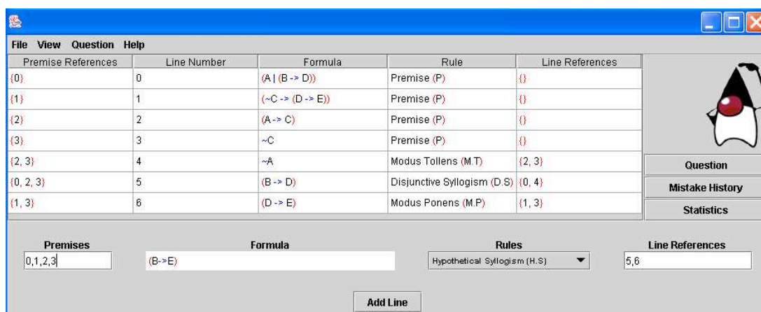
Figure 3: Copie d'un écran du Logic-ITA quand un étudiant approche de la conclusion.

Le Logic-ITA a été utilisé par environ huit cents étudiants de seconde année à l'université de Sydney où il était à la disposition des étudiants en complément d'un cours et de TD traditionnels. Le système se compose d'une base d'exercices, d'un générateur d'exercices et les étudiants peuvent également entrer leurs propres formules à prouver. Une preuve formelle consiste à dériver une formule appelée conclusion à partir d'un ensemble de formules appelées prémisses. Un exercice consiste ainsi à appliquer, pas à pas, des règles logiques pour produire des formules nouvelles jusqu'à l'obtention de la conclusion. Le système dispose d'un module expert qui évalue automatiquement chaque étape de solution proposée par l'étudiant. En particulier, il vérifie si la règle choisie est applicable sur la (ou les) formule(s) sélectionnée(s) par l'étudiant et il fournit une rétroaction avec éventuellement une indication en cas d'erreur. Les étudiants s'exercent quand ils le souhaitent, à leur rythme et ils choisissent l'ordre et le nombre d'exercices qu'ils traitent ; les sessions ne sont pas notées et n'interviennent pas dans l'évaluation.