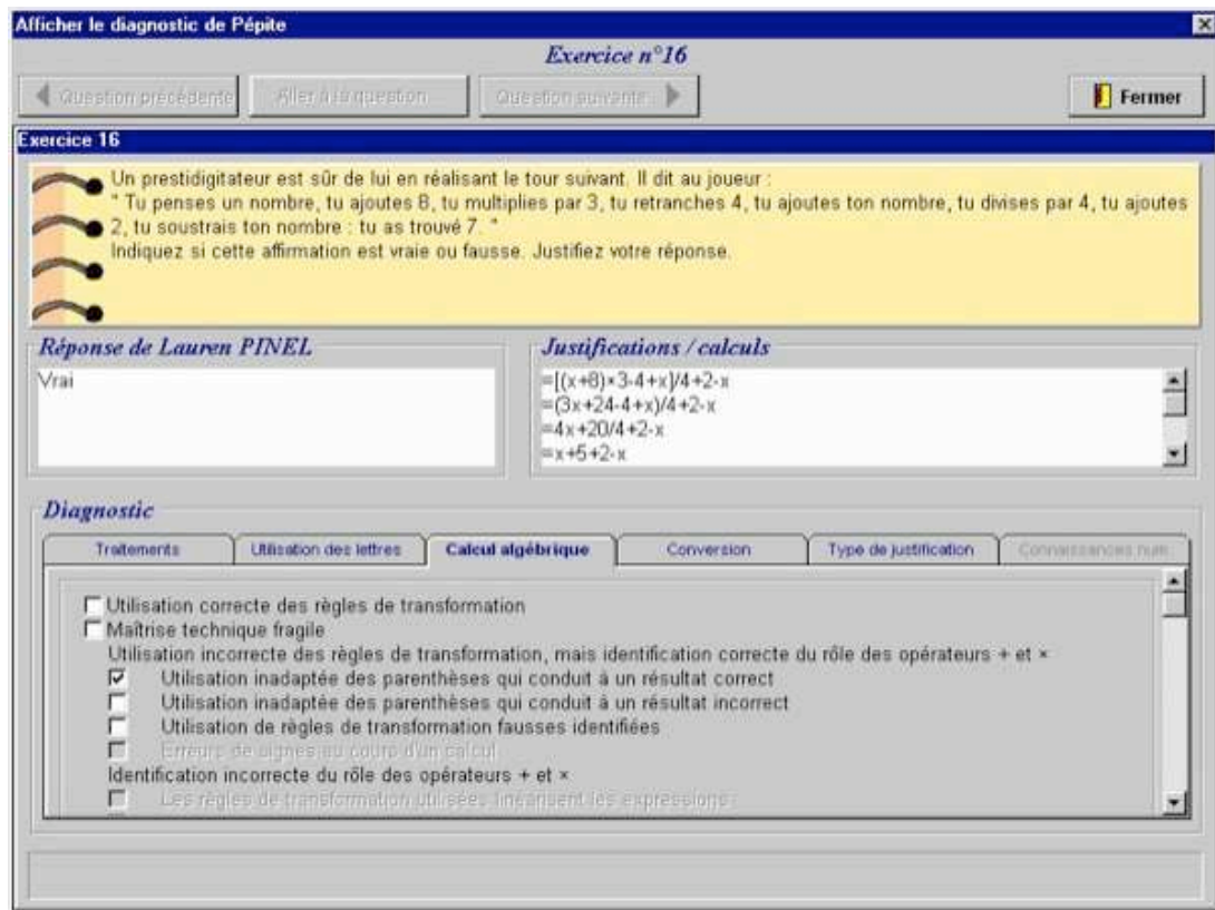
Figure 2: Le diagnostic automatique de Pépite sur 6 dimensions, modifiable par un évaluateur humain.

plus haut niveau sur l'activité de l'élève, le profil cognitif est construit en cumulant, sur l'ensemble des exercices les codes identiques ou en associant ou opposant certains codes. La méthode de cumul et d'association des critères est fondée sur une expertise didactique. Ce profil est exprimé par des taux de réussite, par les points forts et points faibles sur trois dimensions (usage de l'algèbre, calcul algébrique et traduction d'une représentation en une autre). Enfin, en utilisant ce profil, Pépite situe l'élève sur une échelle de compétence sur chacune de ces dimensions en la classant dans une classe de profils (appelée stéréotype).