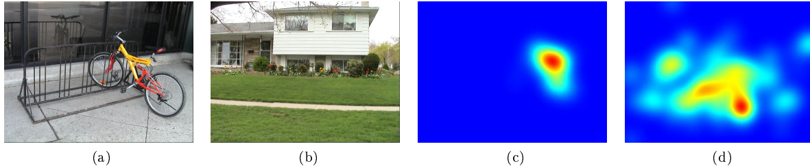
FIGURE 1: Il est difficile de déterminer subjectivement si (a) est plus complexe que (b). Par contre, l’analyse de leurs cartes d’attention respectives (c) et (d) semble indiquer que (a) est perceptuellement plus simple que (d).