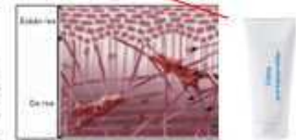
Fig. 1 - Schéma du réseau de fibres de la MEC extracellulaire (Collection BASF) (9)

En cas de vieillissement, la molécule d'élastine était jusqu'à présent moins connue. Grâce à un travail mené conjointement avec le CNRS, BASF a réalisé des découvertes majeures sur l'élastine (5) (6) (7) (8).