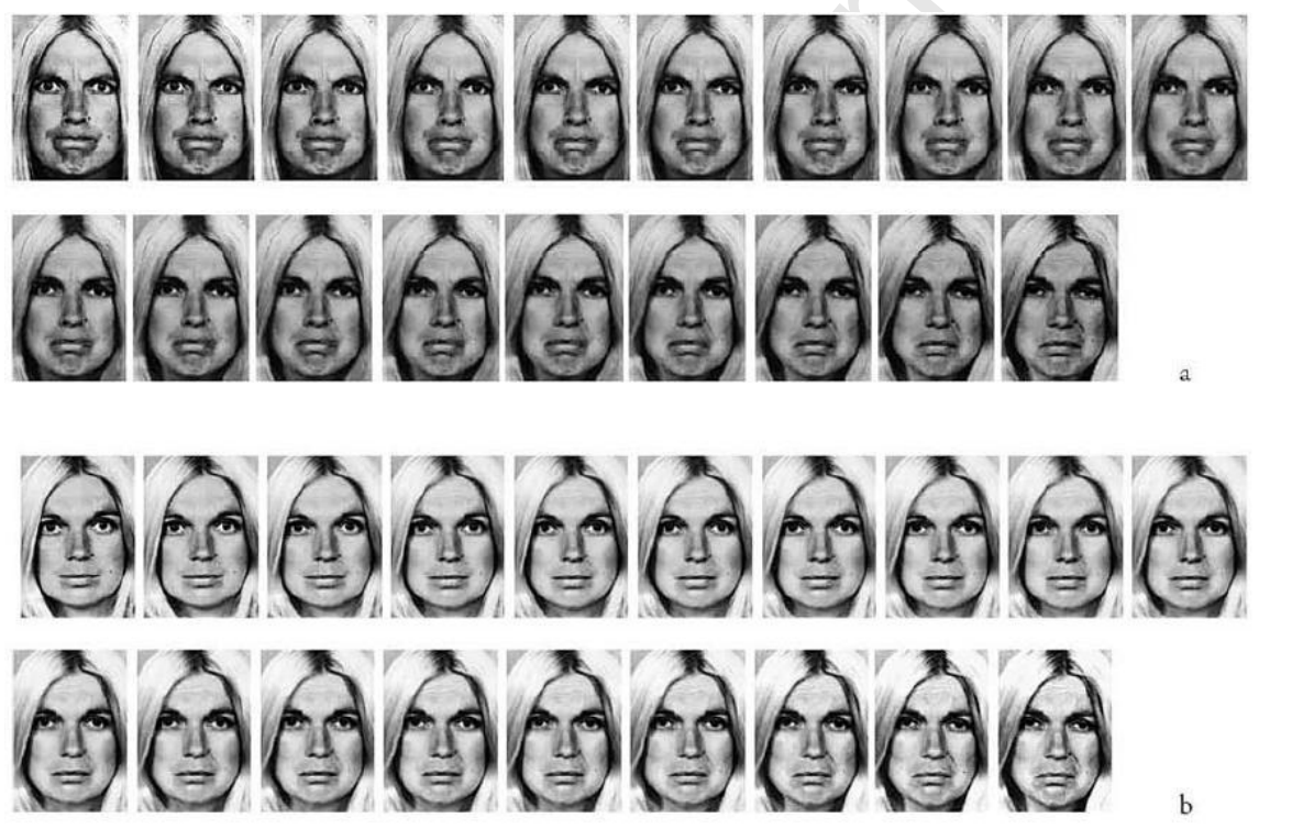
Figure 2 : les séries en colère/triste (a) et neutre/triste (b) chez la blonde

La procédure a été réalisée deux fois : avant et après la mise en route du traitement. Au cours de la partie expérimentée de la session, chaque morphe a été affiché sur l'écran d'un ordinateur portable (n = 38 stimuli). Pour chaque série, les 17 essais ont été affichés de manière aléatoire et la série s'est terminée par l'affichage des deux sources. Dans chaque essai, le morphe est apparu au centre de l'écran, associé à deux étiquettes verbales définissant les deux émotions canoniques de la série. Le sujet devait identifier l'émotion perçue en choisissant l'une des étiquettes et appuyer sur le bouton gauche ou droit de la souris, en fonction du positionnement gauche ou droite de l'étiquette ; ce choix était obligatoire et le morphe restait sur l'écran tant que la réponse n'était pas donnée. À noter qu'aucune réponse juste ou fautive n'était définie a priori.