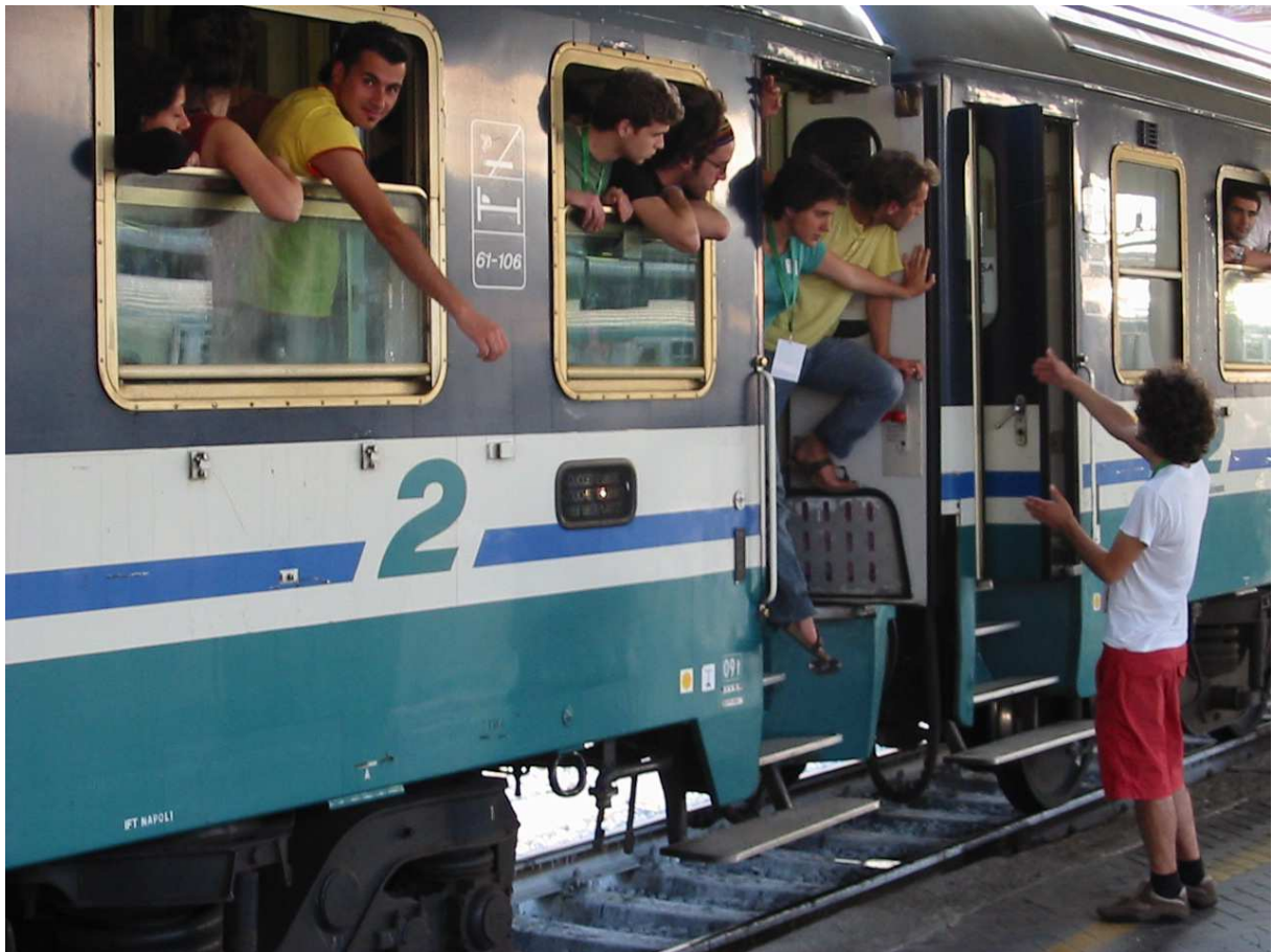
Document 2 – La création de places surnuméraires à bord d'un train grande ligne: exemple en gare de Bologne (mai 2006).

C'est dans un de ces trains qu'a été pris, en période creuse, le cliché du document 1. S'y distingue l'organisation de l'espace personnel du dormeur. La tête est appuyée sur l'oreillette unique, et non posée, car celle-ci est trop étroite. Le train a été conçu pour des trajets courts où le passage l'emporte sur le confort, d'où un certain raidissement du port de tête, incorporant cette contrainte socio-technique. Une jambe est posée sur le rebord de la plinthe. Les bagages sont placés en vis-à-vis. A portée de main, le journal est placé sur le siège voisin et le portable sur la petite console de la fenêtre, dans le prolongement du regard.